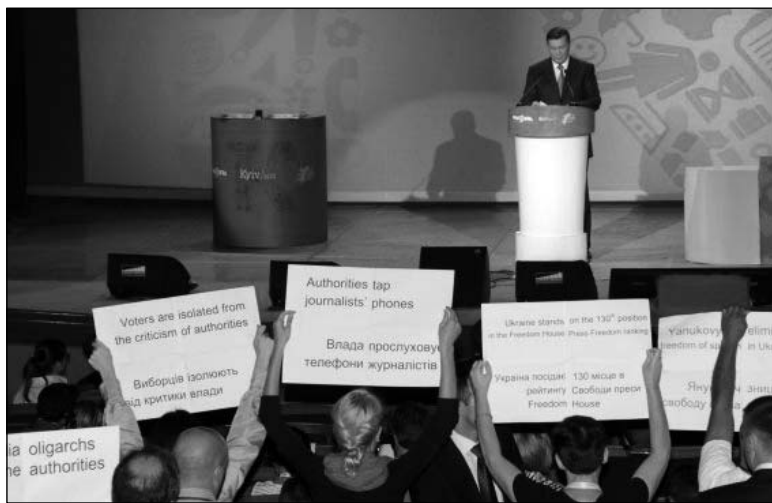
Падчас выступу прэзідэнта Украіны Віктара Януковіча на Сусветным газетным кангрэсе 3. 09.2012

А вось прыклады з параўнальных па маштабу краін вельмі паказальныя. У прыватнасці, газеты «Svenska Dagbladet», якая правяла рэарганізацыю і выйшла на тыраж у 400 тысяч экзэмпляраў, ці медыякампанія «Verbens Gang» у Нарвегіі, што ўзнікла тры гады таму і ўжо выйшла ў лідары ў мабільным інтэрнэце, ці развіццё найбуйнейшай газеты на каталонскай мове ў Іспаніі.