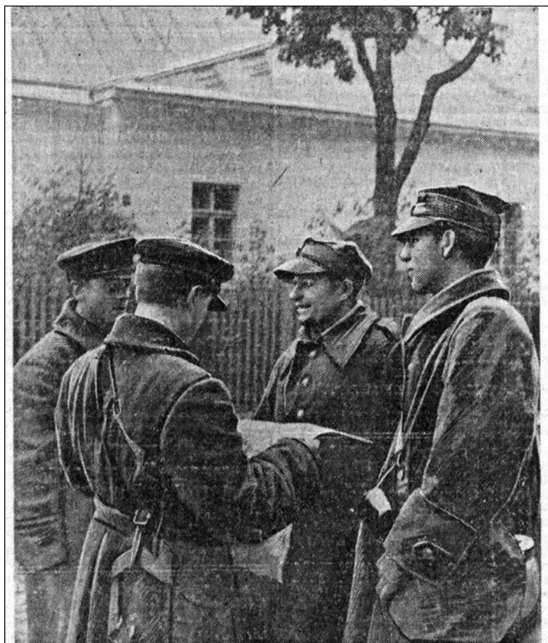
Западная Беларусь, район гор. Гродно. Красноармейцы читают газету пленным польским солдатам.

ваяводстваў Другой Рэчы Паспалітай было мала. Большасць баяздольных частак і палкоў перад самай вайной былі перакінуты на захад краіны. Але тыя падраздзяленні, якія заставаліся на «крэсах», у большасці сваёй аказалі супраціў Чырвонай Арміі. Напрыклад, не проста прыйшлося чырвонаармейцам у баях пад Пінскам, дзе, як адзначаў журналіст «Камсамольскай праўды», «польскія кавалерысты спрабавалі акружыць савецкія часткі». Жорстка баі Чырвонай Арміі давалася весці на подступах да Скідзеля. Адным са сведкаў тых падзей быў карэспандэнт «Праўды», які адзначаў, што польскія салдаты не проста ўмацаваліся, але і знішчылі пераправу. Савецкім танкістам давалася перапраўляцца праз раку пад градам куль. Некалькі савецкіх танкаў было падбіта.