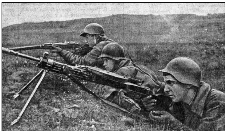
Бой блізу Гродна