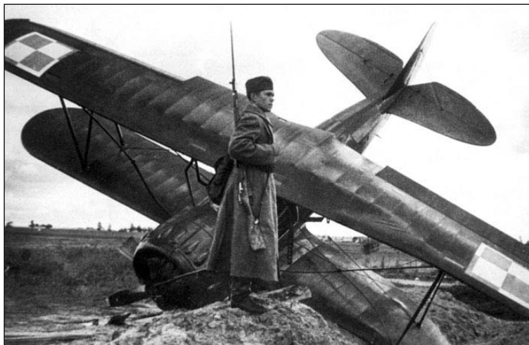
Збіты польскі самалёт

Агрэсія супраць Польшчы, насуперак чаканням савецкага кіраўніцтва, не стала лёгкай прагулкай для Чырвонай Арміі. Безумоўна, польскіх войскаў на тэрыторыі заходнебеларускіх