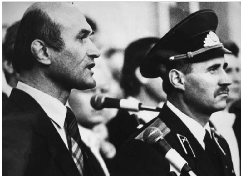
Уступнае слова да прысягі. Зянон Пазьняк і Мікола Статкевіч