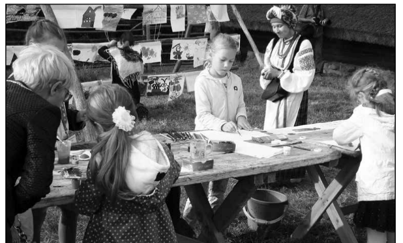
Дзіцячая пляцоўка для будучых мастакоў