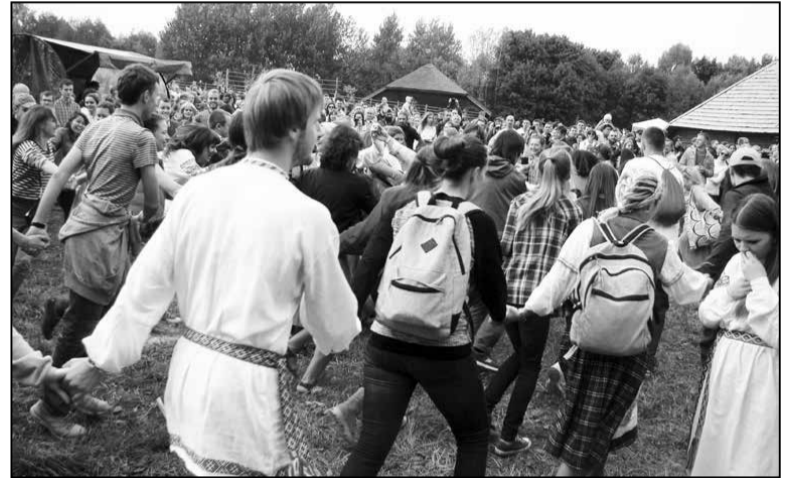
Танцавальная віхура на «Камяніцы»

мадскі трэнд на нацыянальныя рысы ў вопратцы падтрыманы народнымі майстрамі і гандлярамі, якія ў патрэбны час змаглі прапанаваць ахвоным вышыванкі, вышымайкі і шмат іншага фэстывальнага мерчу ў нацыянальным стылі. Добры знак!