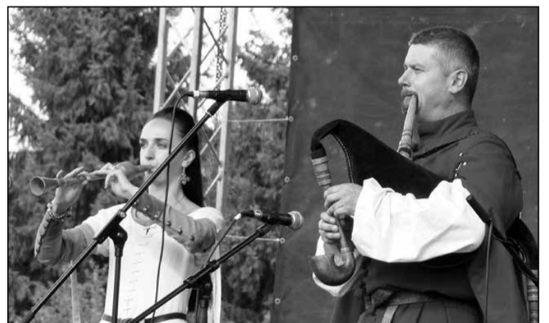
Любімыцы публікі — «Стары Ольса»