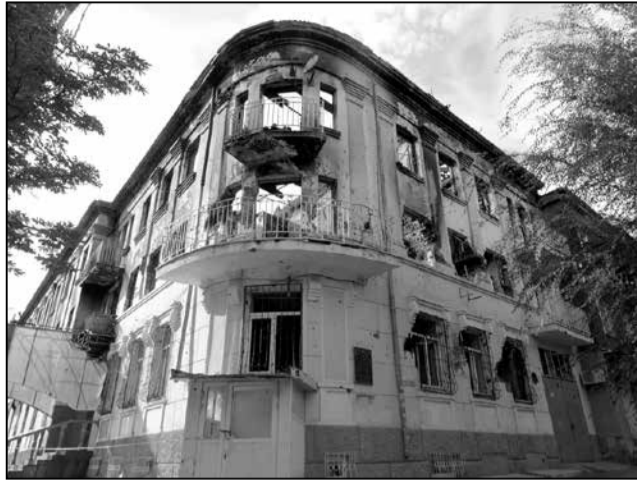
Былы будынак Марыупальскага ГУУС