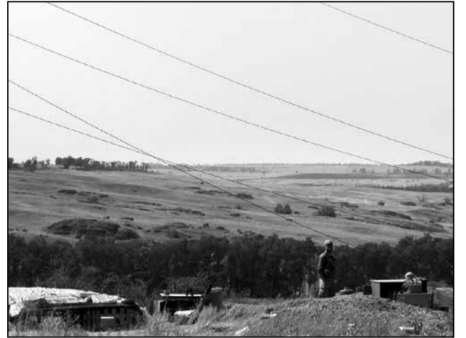
За пагоркамі пазіцыі сепаратыстаў