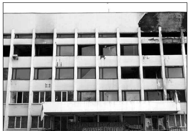
Былы будынак Марыупальскай гарадміністрацыі

Я пакідаў Марыупаль нават з сумам. А ці можа было іначэй, развітаўшыся з адкрытымі, шчырымі людзьмі, якія працягваюць жартаваць, нават ведаючы, сённяшні дзень для любога з іх, магчыма, апошні ў жыцці? І той самы час яны працягваюць свой самаахвярны чын дзеля вольнай будучыні сваіх дзяцей, сваёй Радзімы.