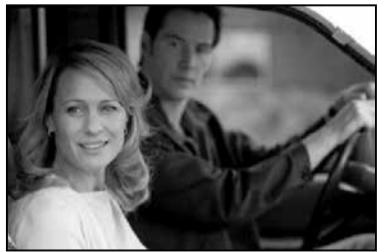
02.05 Начныя навіны.

11.00 Нашы навіны. 11.05 Навіны спорту. 11.10 «Фазэнда». 11.50 «Модны прысуд». 13.00 Нашы навіны. 13.05 Навіны спорту. 13.10 «Мужчынскае / Жаночае». 14.05 «Вучыцца жыць». 16.00 Нашы навіны. 16.10 Навіны спорту. 16.20 Мастацкі фільм «Сямейнае шчасце». 18.00 Нашы навіны (з субтытрамі). 18.15 Навіны спорту. 18.20 Чакай мяне Беларусь. 18.55 «Поле цудаў». 20.00 Час. 20.30 Нашы навіны. 21.00 Навіны спорту. 21.05 Самы лепшы дзень. Канцэрт. 22.50 Вячэрні Ургант. 23.50 Легенды Live. 00.30 Мастацкі фільм «Прыватнае жыццё Піпы Лі».