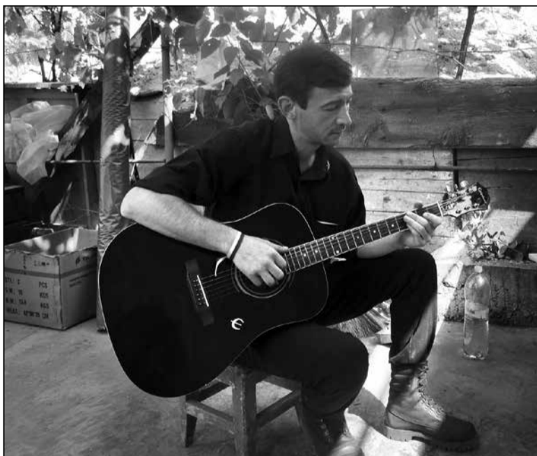
Выступ на 11-м БП за гадзіну да мінамётнага абстрэлу

зямлю да апошняга, а ў настроях многіх мясцовых жыхароў за апошнія месяцы сузіральная абьякавасць змянілася патрыятызмам. Пра гэтае ж пазней казалі ў размовах марыупальскія валанцеры.