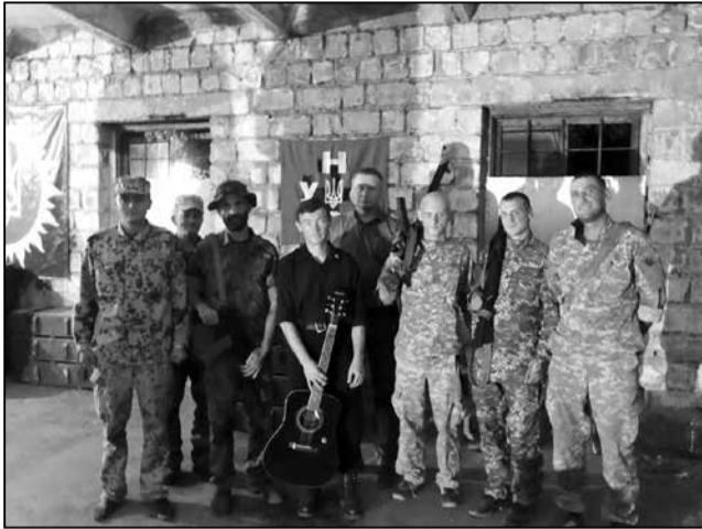
3 байцамі Дабравольчага батальёну УНСО