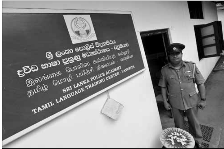
Трохмоўная шыльда цэнтра вывучэння тамільскай мовы паліцэйскай акадэміі

Колькасць ланкійскіх тамілаў у англамоўнай дзяржаўміністрацыі была большай, чым іх працэнт у насельніцтве (у значна большай ступені гэта было ўласціва нешматлікім нашчадкам еўрапейска-цэйлонскіх шлюбав і еўрапейцам). Сінгалы ж складалі там меншы працэнт. Шэраг аўтараў называе гэта праявай каланіяльнай палітыкі «падзяляй і валадар». Частка сінгалаў лічыла, што пры брытанцах ланкійскія тамілы былі ў прывілеяваным становішчы. Ёсць меркаванне, што сітуа-