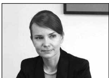
Кейт Пентус-Розіманус.

Эстонія — краіна, досыць вядомая праз сваю свабоду слова, — насамрэч не плануе ніякай контрпрапаганды. Міністр замежных спраў Эстоніі Кейт Пентус-Розіманус падкрэслівае, што новы тэлеканал, які будзе запушчаны ўжо восенню, не з'яўляецца спробай контрпрапаганды. Гэты канал «проста будзе вяртацца на рускай мове і прапаноўваць альтэрнатыву нашым мясцовым рускамоўным жыхарам, і дасць магчымасць рэалізавацца рускамоўным журналістам. Іншымі словамі,