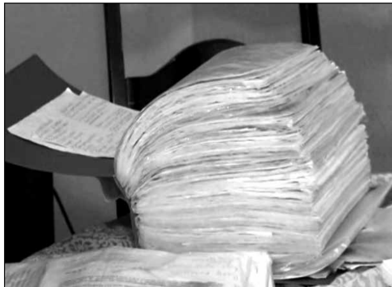
Вось колькі папер сабралася за тры гады змагання за дом