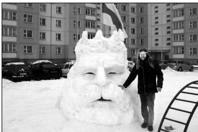
Скульптурны пленэр «Lehienda z piasku». І са снегу

Калі 13 чэрвеня 1984 года адбыўся пікет супраць зносу першага беларускага тэатра, улады ўзяліся за «Майстроўню», як кажуць, напоўніцу. Супраць невялікай групы пратэстнай