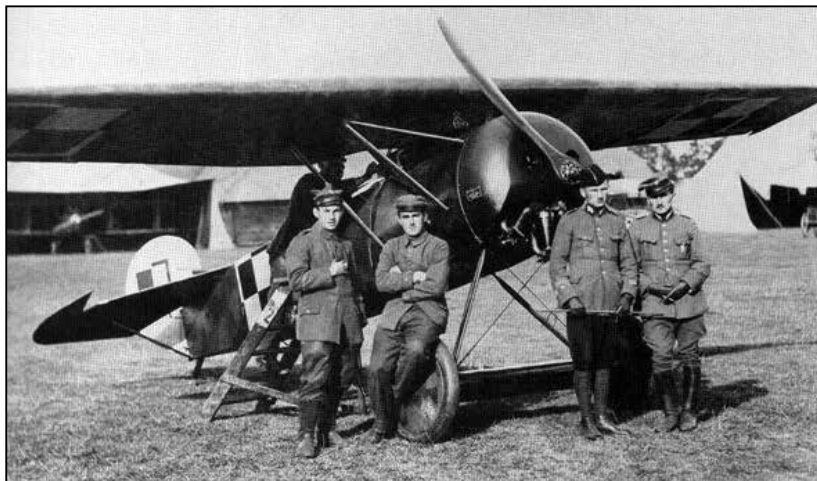
Польскі самалёт на аэрадроме Кісялевічы пад Бабруйскам