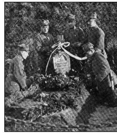
Польскія жаўнеры падчас пахавання ля кургана ў Бабруйскай крэпасці, 1919 г.