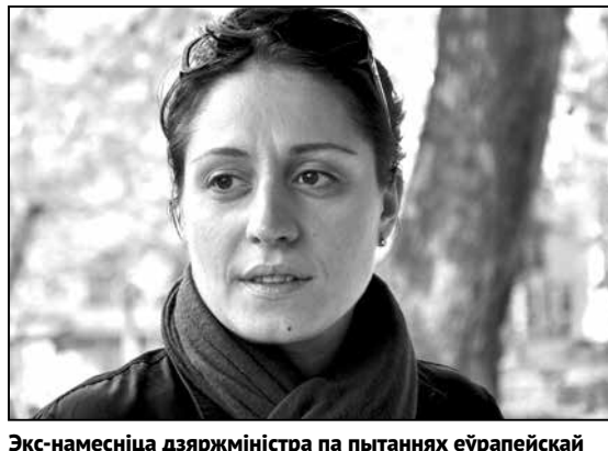
Экс-намесніца дзяржміністра па пытаннях еўрапейскай і еўраатлантычнай інтэграцыі Эленэ Хаштарыя

грузінскіх вайскоўцаў у аперацыях у Іране, Афганістане падняў армію на абсалютна іншы ўзровень. Канешне, нам трэба развівацца далей, але войска цяпер дакладна не савецкае», — рэзюмуе Эленэ Хаштарыя.