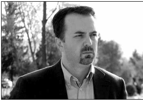
Экс-міністр абароны Грузіі Дзмітрый Шашкін