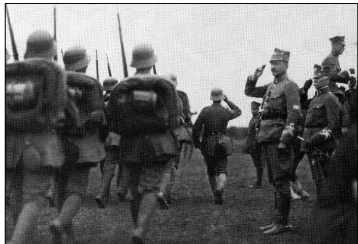
Юзаф Доўбар-Мусніцкі прымае парад велькапольскіх войскаў, 1919 г.