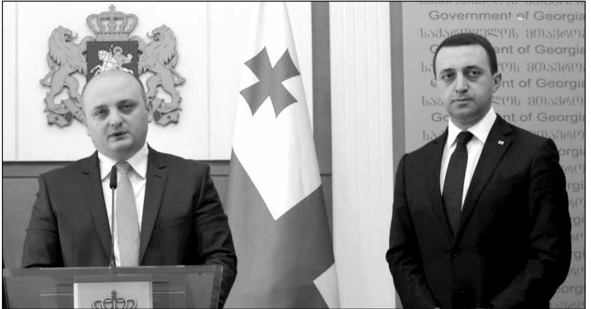
Прэм'ер-міністр Грузіі Іраклій Гарыбашвілі (справа) і новы міністр абароны Грузіі Міндзія Джанелідзе