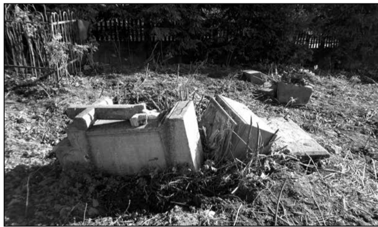
Зруйнаваны помнік Юзафу Абламовічу на старых Койданаўскіх могілках, заснаваных на пачатку XIX стагоддзя

Пасля мы пазнаёмімся бліжэй з тымі негарэльцамі. Яны былі ліхімі, хітравымі ад нас і больш прыстасаванымі да жыцця ў дзяржаве. Гэта мы хадзілі за 3 кіламетры, нягледзячы на забарону,