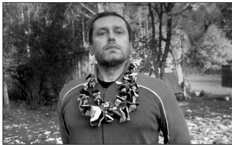
З сушанымі грыбамі