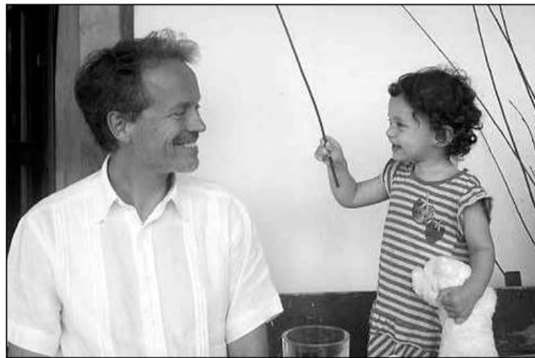
Сэфан і Сэфанія (Былы амбасадар Швецыі ў Беларусі Сэфан Эррыксан з дачкой Зміцера Вайцюшкевіча)