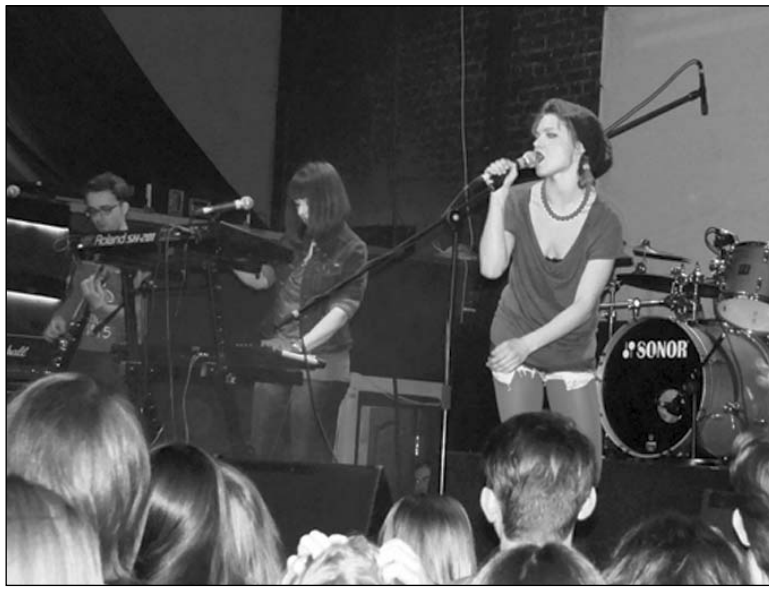
Гурт «Clover Club»

Так адбылося і на гэтым канцэрте, дзе музыканты выканалі некалькі кампазіцый з апошняга альбому «Рэкі прабілі лёд». Высокі прафесіяналізм і небанальны