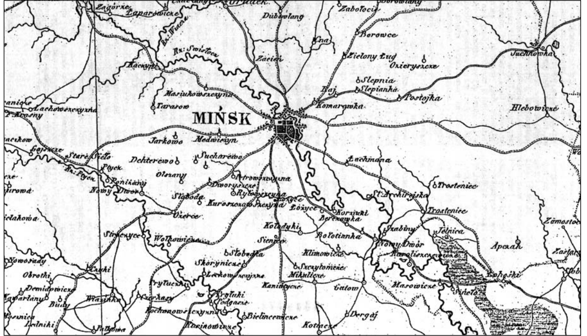
Мапа, якой карысталіся паўстанцы

Леанід Лыч падкрэслівае, што будучы «Вешальнік» яшчэ ў 1827 годзе, калі ён знаходзіўся на пасадзе Віцебскага генерал-губернатора, зразумеў, што насельніцтва былой гістарычнай Літвы шмат у чым адрозніваецца ад рускіх, і перш за ўсё ў мове. Безумоўна, турбаваў яго і «польскі фактар», які існаваў яшчэ з часоў І Рэчы Паспалітай. Тады ў М. Мураўёва і выспела разуменне, што змяніць сітуацыю на карысць Расійскай імперыі ў гэтым рэгіёне можна толькі з дапамогай рускай адукацыі. Польскі гісторык Хенрык Масціцкі ў адной са сваіх манаграфій прааналізаваў карэспандэнцыю віленскага генерал-губернатора і прыйшоў да высновы, што русіфікацыя і памяншэнне колькасці «небяспечнага польскага элемента» ў Паўночна-Заходнім краі