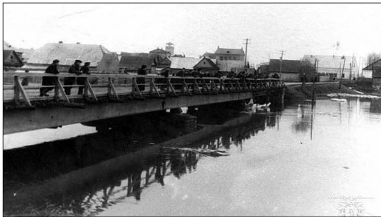
Шаркоўшчына, водны млын. Здымак сярэдзіны 1950-х гадоў

асобных выразаў, мясцін з іх. Уражвала неяк асязальна вершаванае слова з яго вуснаў.