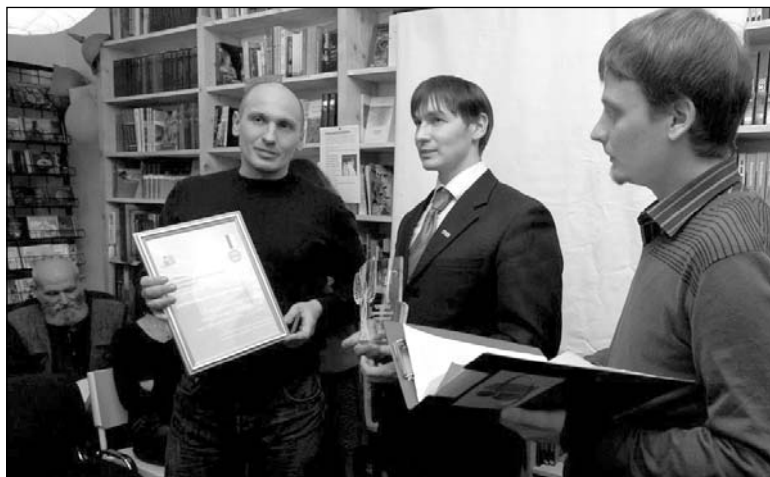
«Рэгіянальнай падзей» Асамблея вызначыла стварэнне структуры незалежнага прафсаюза на прадпрыемстве «Граніт»

У нашай краіне сама дзейнасць НДА ёсць падзвігам. Няўрадавыя арганізацыі зведваюць ціск, адмовы ў рэгістрацыі, іх дзейнасць часцяком перарываецца як Міністэрствам юстыцыі, так і міліцыяй. Але яны жывуць. І маюць намер выжыць надалей. І яшчэ ўручаюць свае прэміі.