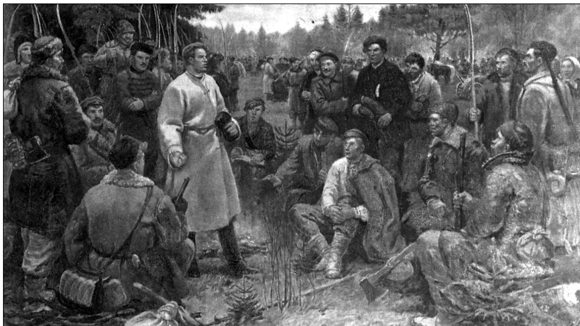
Кастусь Каліноўскі перад паўстанцамі. Мастак П.Сяргіевіч

Пазіцыю Гігіна і яго аднадумцаў можна ахарактарызаваць вельмі проста — збаўленнем ад беларускасці. Галоўнай задачай сённяшніх адэптаў заходнерусізму ў Беларусі з'яўляецца барацьба супраць нацыянальнай памяці і гістарычнага мінулага беларусаў. Усе нацыянальныя матывы беларускай гісторыі для іх з'яўляюцца або «буржуазным нацыяналізмам», або «польскай інтрыгай». У гэтым яны, шмат у чым паўтараюць сваіх царскіх і савецкіх паплечнікаў-русіфікатараў. А для Беларусі паўстанне Кастуса Каліноўскага назаўсёды застаецца лёсавызначальнай падзеяй, што аказала ўплыў на фармаванне нацыянальнай свядомасці беларускага народа. Так было і так будзе.