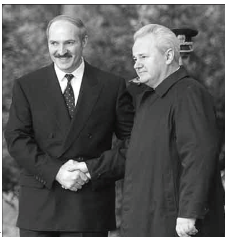
Аляксандр Лукашэнка і Слабадан Мілошавіч

На жаль, у арсенале чалавецтва ёсць і практычны досвед, калі дэмакратычная форма не падмацавана дэмакратычным зместам. Імітацыйная дэмакратыя, якая