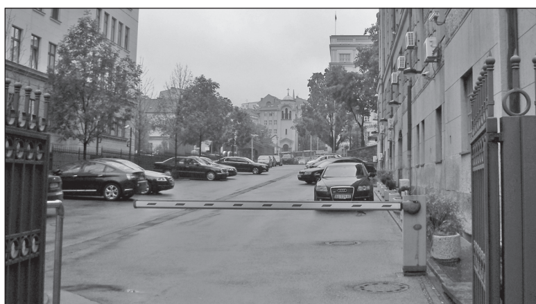
Праезд да будынку Дома ўрада. Справа, прыкладна на тым месцы, дзе стаіць другая машына, стрэлам са снайперскай вінтоўкі быў забіты ў 2003 годзе тагачасны прэм'ер Зоран Джынджыч

Узгадваю эпізод са спробай імпічменту, які арганізавала частка дэпутатаў Вярхоўнага Савета 13-га склікання новаабранаму прэзідэнту Аляксандру Лукашэнку. У былой рэзідэнцыі ЦК КПБ, што месцілася ў завулку Фрунзэ, да ночы ішлі перамовы паміж