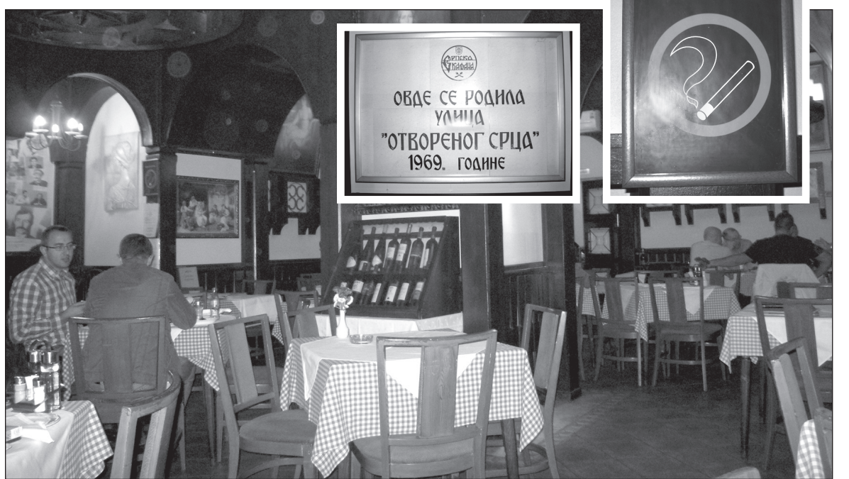
Жыццё працягваецца. Рэстаран, заснаваны яшчэ ў 19 ст. Папулярны ў творчых колах. Ля ўвахода фота і аўтографы знакамітых наведвальнікаў. Адносна танны. Добры абед з півам каштуе вакол 10 еўра

На сёння ў Сербіі самай моцнай і ўплывовай фігурай з'яўляецца Аляксандр Вучыч, намеснік прэм'ера. І менавіта ад яго, на погляд многіх аналітыкаў, сыходзіць небяспека ўзмацнення аўтарытарнай тэндэнцыі. У доказ