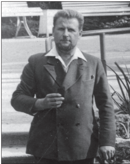
Езавітаў, Кемеры, Латвія, 1934

З пажаўцелага крыху, абробленага па краях фота глядзіць мажны чалавек у цывільнай вопратцы, у яго валявы выраз твару, поўны ўнутранай годнасці і самаўпэўненасці. Поруч — разная прыгожая альтанка, выгнутыя спінкі драўляных лавак, выкладзены неапрацаваным каменнем грот — курортны экстр’ер.