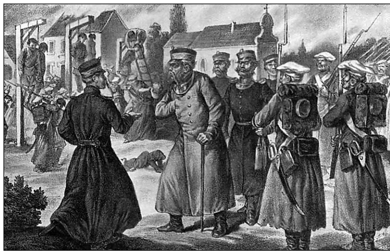
Мураўёў назірае як вешаюць паўстанцаў