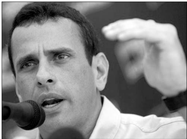
Энрыке Капрылес Радонскі