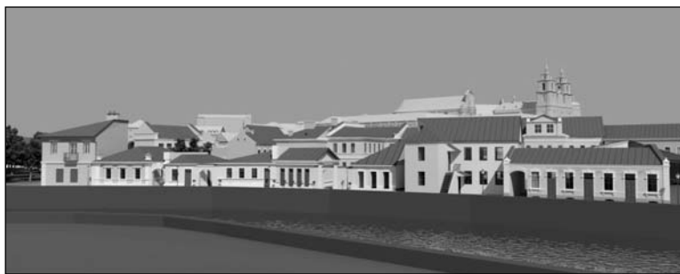
Вуліца Гандлёвая ў 1950-я гады і фрагменты праекту грамадскаспі

выя галерэйнага тыпу, якімі была забудавана вуліца.