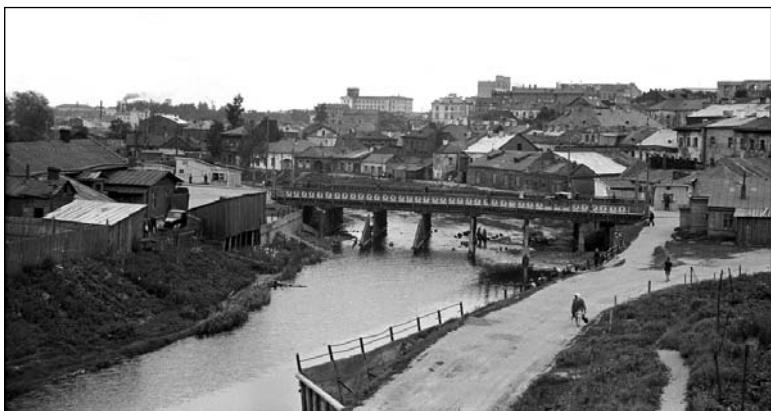
Вуліца Гандлёвая ў 1950-я гады