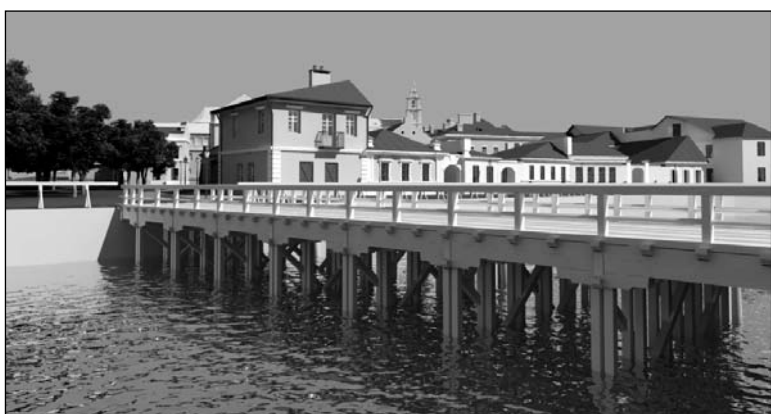
Фрагменты праекту грамадскаспі