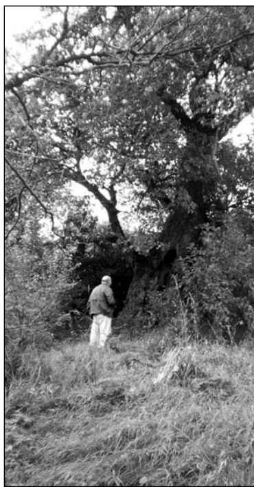
Вяз — сведка даўніх падзей

якая абрынулася тады на ўсю Беларусь. Сын каралевы, Казімір, пражыў усяго 16 гадоў, а цудоўны горад паўтарыў яго лёс.