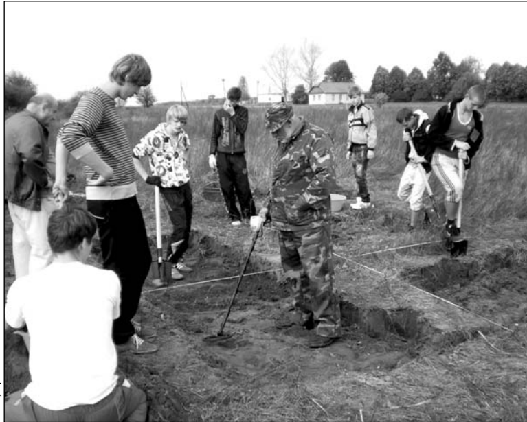
Навучэнцы каледжа на раскопках

У Казіміры існавалі ратуша з гадзіннікам, прыстань, праводзіліся чатыры кірмашы на год. Квітнелі і шматлікія рамёствы: выплаўлялася шкло, выраблялася кафля, кваліфікаваныя майстры займаліся апрацоўкай металу. І сёння на гэтым месцы, магчыма, існаваў бы вялікі сучасны горад, калі б не вялікая бяда,