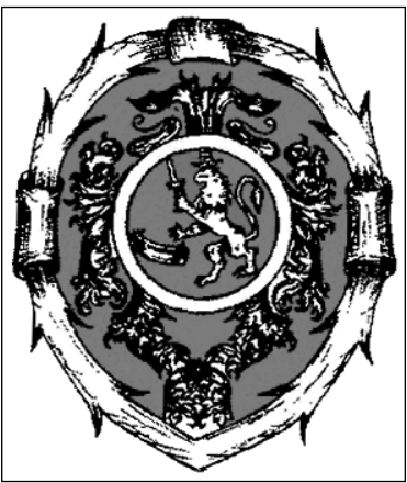
Герб г. Казіміра

З выдатным беларускім археолагам, доктарам гістарычных навук, прафесарам Сяргеем Рассадзіным шчаслівы лёс звёў мяне сёлета, калі ён з групай студэнтаў Горацкай сельскагаспадарчай акадэміі вёў археалагічныя даследаванні на тэрыторыі старажытнага Лаўрышаўскага манастыра. Нядаўна Сяргей Рассадзін запрасіў мяне на раскопкі старажытнага беларускага горада Казіміра, які існаваў больш за 350 гадоў таму на тэрыторыі сённяшняга Светлагорскага раёна Гомельскай вобласці.