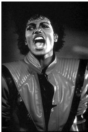
Майкл Джэксан у постмадэрновым кліпе «Трылер»

Наступіла, па словах філосафа Ліатара, «эпоха постмадэрну». У Францыі віравала студэнцкая і сексуальная рэвалюцыя, калі элітарны рэжысёр Гадар распаўсюджваў маоісцкія ўлёткі для масаў, а юнакі, натхнёныя інтэлектуальным сінэмаграфам, ладзілі любоў на траіх («Летуценнікі»