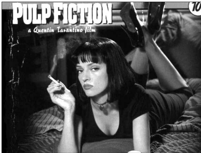
«Крымінальнае чытво» — ключавы постмадэрновы фільм

Постмадэрнізм — крызісны пераход. Калісьці такім быў маньерызм — у мастацтве, скептыцызм і кінізм — у філасофіі. Але, у адрозненні ад папярэдніх часоў, сённяшні культурніцкі крызіс суправаджаецца спажывецкай асалодай.