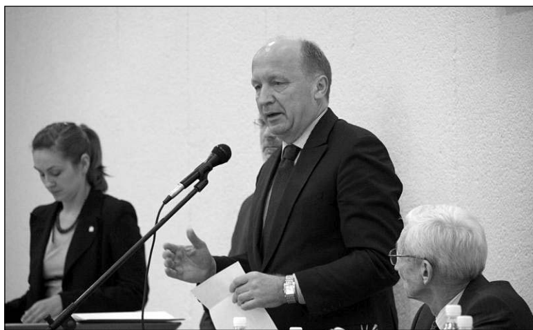
Студэнтаў вітае Андрус Кубілюс

— Пытаннем на пытанне: а ці ёсць у Беларусі нацыянальная традыцыя адукацыі? Калі нехта думае, што савецкая адукацыя, якая засталася ў спадчыну сённяшняй Беларусі, ёсць адметнай нацыянальнай традыцыяй, я з гэтым не пагаджуся. Можна крытыкаваць беларускае ЕГУ пад рознымі ракурсамі: беларускамоўнасць універсітэта, беларускі кантэкст зместу — чаму і як навучаюцца, колькасць выпускнікоў, якія вяртаюцца ў Беларусь. Для мяне беларускае — гэта адчужанне сябе беларусам у Літве, што нашмат хутчэй і больш глыбока адбываецца ў Вільні, чым гэта было ў Мінску. У мяне ёсць магчымасць параўнаць беларускае ўніверсітэта мінскага і віленскага перыядаў. І я гатовы сказаць: нашмат глыбей і больш сур'ёзна беларускае асэнсоўваецца і жыве тут, у Вільні. Калі глядзець на статыстыку — колькі выкладчыкаў карыстаюцца беларускай мовай, то гэта прыкладна карэлюе з распаўсюджанасцю беларускай мовы ў краіне. Калі 15 і менш працэнтаў жыхароў Беларусі карыстаюцца беларускай мовай, то паспрабуйце павялічыць гэты працэнт да трыццаці ў Вільні! Штучна па моўнай прыкмеце адбіраць людзей для працы ва ўніверсітэце няслушна. Яшчэ я звярнуў увагу на колькасць сустрэч ва ўніверсітэце з дзесяцімаі беларускай культуры, палітыкі — ад Зянона Пазняка да Алеся Разанава. Вы мусілі заўважыць падчас адкрыцця навучальнага года, што наш універсітэт у Літве не можа быць ні чыста беларускім, ні чыста літоўскім, ні чыста англійскім. Пашукайце самі адказ на пытанне, у якой камбінацыі гэта можна ўзрасціць у жывой інстытуцыі.