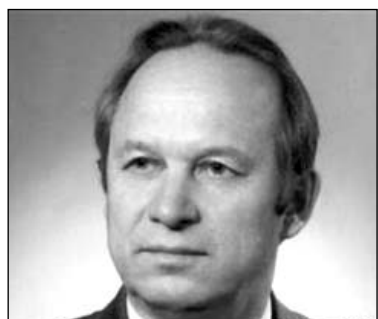
Мікалай Дземянец, старшыня ВС БССР 1990-1991

кусію па пытанню, ці патрэбны краіне прэзідэнт. Дэмакраты заяўлялі, што прэзідэнт — гэта шлях да дыктатуры.