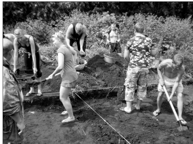
На археалагічных раскопках