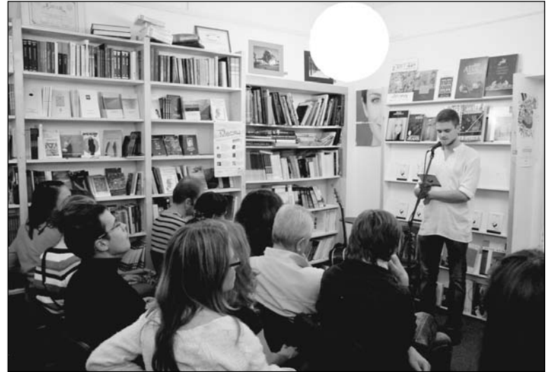
Аўтар зачытвае ўрывак з кнігі

Прэзентацыя, нягледзячы на выходны дзень, сабрала нямала людзей розных узростаў. Якія, дарэчы, ледзь умясцілі гасціннае зала кнігарні. Мерапрыемства прайшло традыцыйна для такіх сустрэч: брутальныя вядучы, добрыя словы і пажаданні, чытанне аўтарам сваіх твораў і аўтографсесія. Не зусім звычайным для