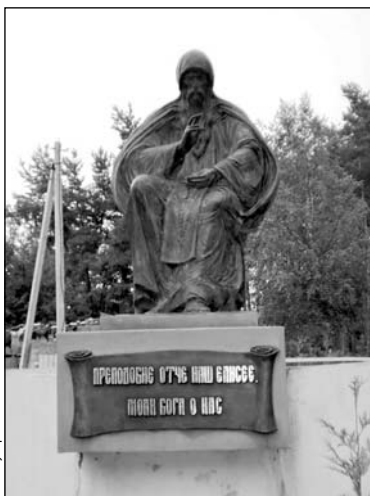
Помнік Елісею Лаўрышаўскаму

сваім звар'яцелым паслушнікам, і яго святых мошчы з цягам часу пачалі славіцца шматлікімі цудатварэннямі.