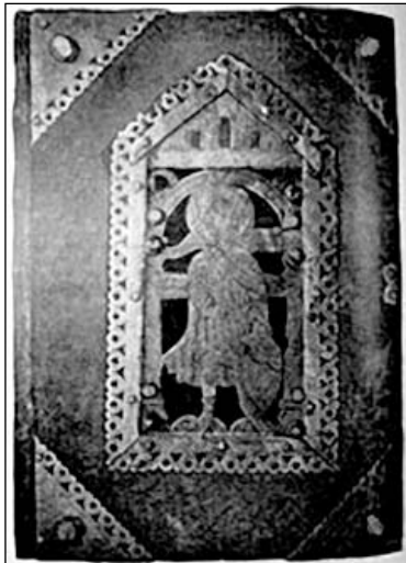
Вокладка Лаўрышаўскага Евангелля

Пра жыццё прападобнага Елісея сведчанняў дайшло да нашага часу няшмат, бо шматлікія войны, якія вогненнай віхурай пранесліся па гэтай зямлі, знішчылі ўсе сляды яго біяграфіі. Вядома толькі, што Елісей Лаўрышаўскі ў 1250 годзе быў забіты