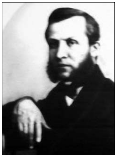
Адам Антонавіч Артымовіч

Увесну 1791 года ў часе Вальнага Сойму польскія магнаты і апалчаныя беларуская шляхта, імкнучыся ўмацаваць Польшчу, над якой нависла пагроза з боку Аўстрыі, Прусіі і Расіі, заявілі пра неабходнасць увядзення спадчынай манархіі і зліквідавання адметных дзяржаўных структураў Вялікага Княства. Так здзейснілася мара нашых заходніх суседзяў. Беларускае гаспадарства з гэтага моманту дэ-юре ўвайшло ў склад Польшчы. Праўда, ненадоўга. У маі 1792 года расійская армія пад камандаваннем Крачэнікава захапіла Вільню і ўсталявала кантроль над нашымі землямі. А ў 1793 годзе Расійская імперыя анексавала цэнтральную частку Беларусі (усходнія землі былі захопленыя яшчэ раней — у 1772 годзе).