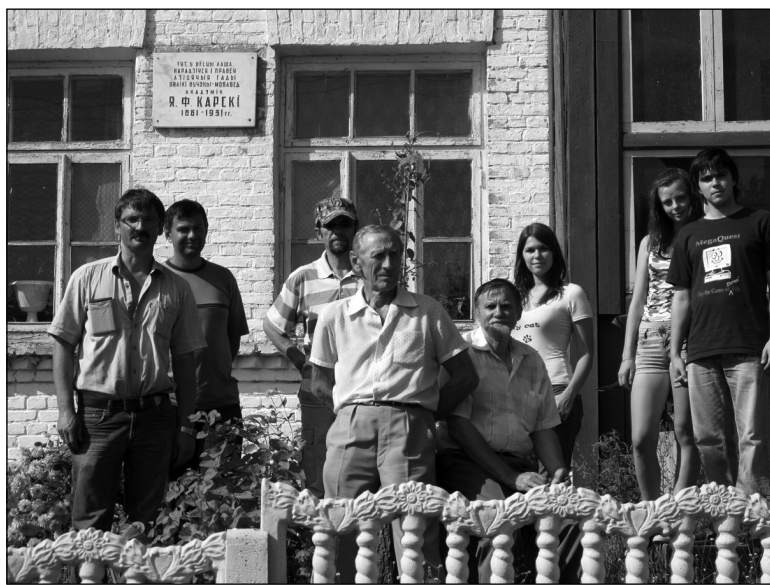
Лаша. Гродзенскія краязнаўцы і студэнты ГрДУ каля будынка, дзе знаходзіўся першы музей Я.Карскага (1964—1992)

Брат Яўхіма Мікалай працаваў у банку Рацова. Іван быў святаром Мінскага павета ў Блячыне, дзе ў 1920 годзе выпадкова з Карскімі-Навіцкімі (Яўхімам і Іванам) пазнаёміўся гімназіст, будучы вядомы паэт Новік-Піюн. Брат Аляксандр быў начальнікам руху Варшаўскай чыгункі, напісаў падручнік для інжынераў-чыгуначнікаў. Сястра Вера — замужам у Таліне. Марыя — замужам за святаром у Менскім павеце. У Волме пад Мінскам у 1902 годзе памерла Магдаліна Карская — маці Яўхіма. Бацька Фёдар памёр праз 16 гадоў, у 1918-м, і пахаваны каля царквы Бутча Слуцкага павета (сёння Ганцавіцкі раён). Новыя звесткі пра бацькоў і дзяцей Карскіх-Навіцкіх з’явіліся толькі ў 2007–2008 гадах дзякуючы дырэктару Клецкага гісторыка-этнаграфічнага музея А. Бліню і праўнуку Яўхіма Карскага — А. Карскаму.