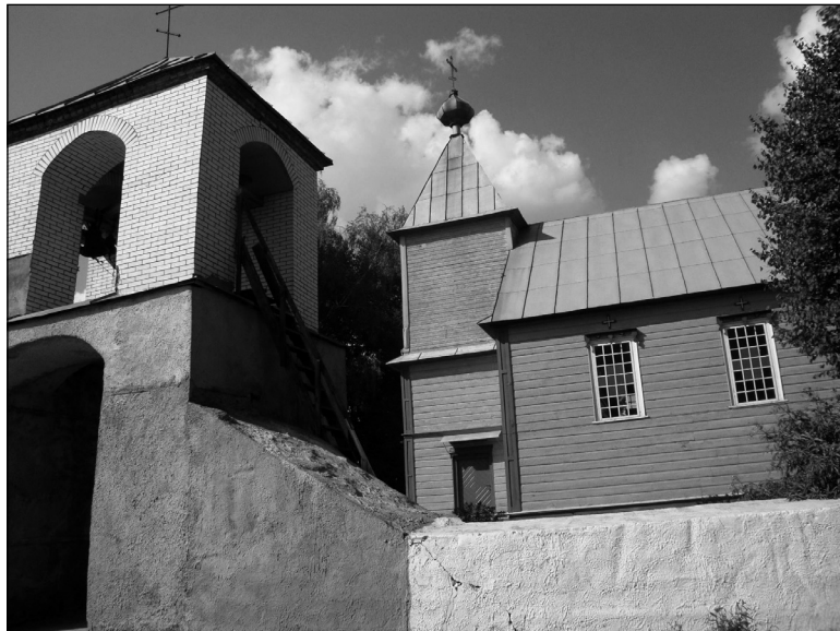
На радзіме Я.Карскага. Лашанская Свята-Мікалаеўская царква