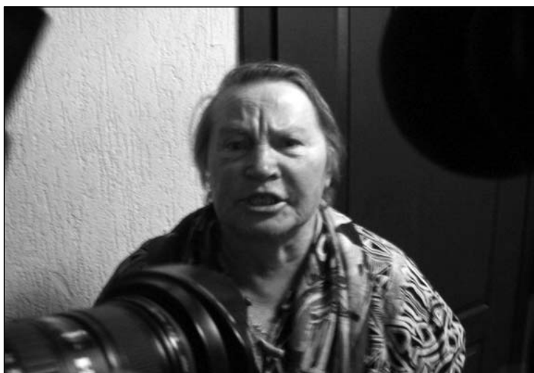
Маці Дзмітрыя Уса назвала прысуд сыну палітычнай расправай