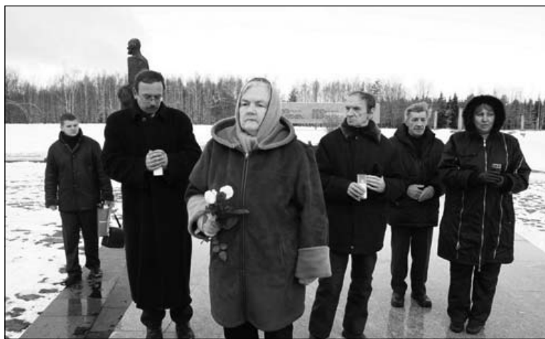
Акцыя ў Хатыні. 22 сакавіка 2009 г.

яшчэ адзін твор — дакументальную аповесць «Распятая Хатынь», якая выйшла ў 2005 годзе.