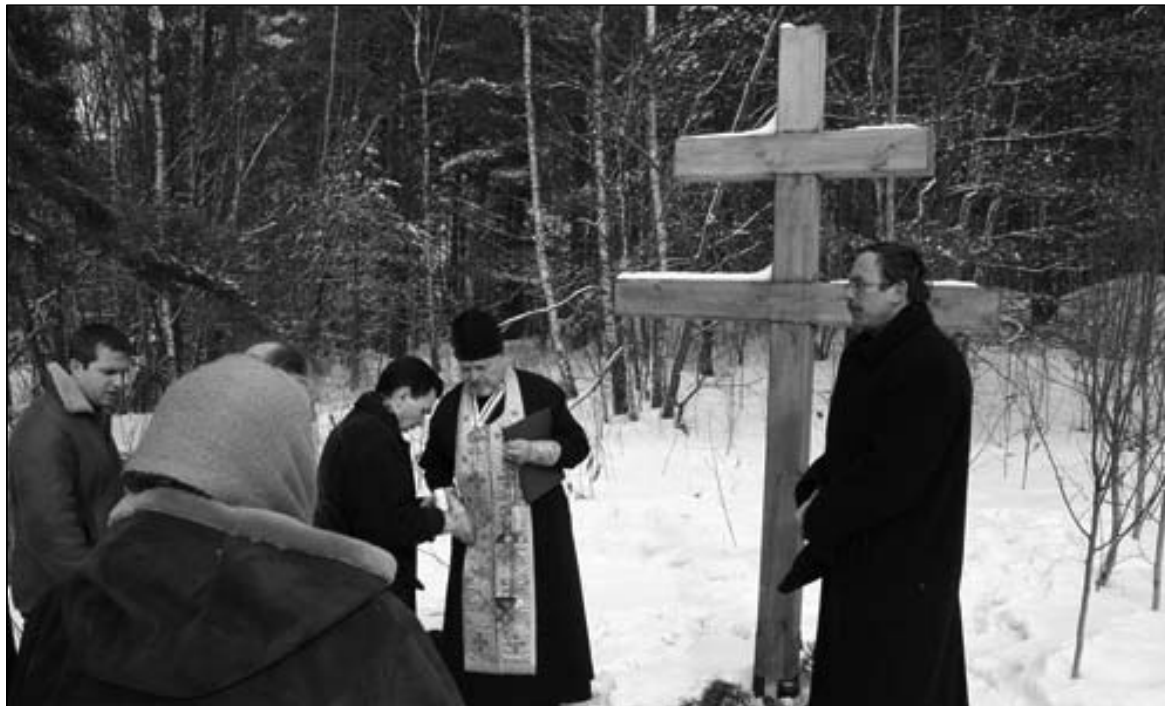
Асвячэнне крыжа ў Вялікай Губе, 22 сакавіка 2009 года

Кніга «Жаўрукі над Хатынню» выйшла ў 1973 годзе. Але тое, як збіраліся матэрыялы для яе напісання, цяжкасці, з якімі сутыкнулася аўтарка падчас выхаду кнігі ў друк, новая, жывая інфармацыя сведкаў, якую нельга было ставіць у кнігу, — далі падставу напісаць