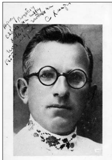
Сяргей Хмара. 1955 г.