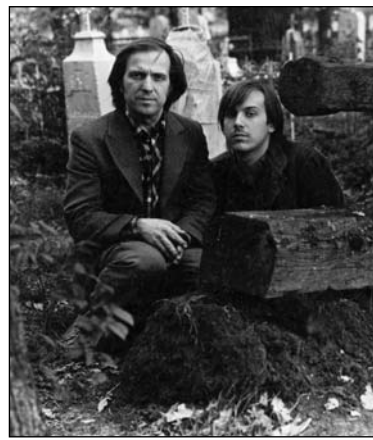
На старых могілках

ны дым з пылам... І ён з бацькам дыхалі гэтым радыяцыйным паветрам.