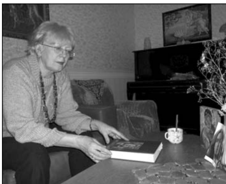
МУЗЫКА ЗА КРАТАМІ