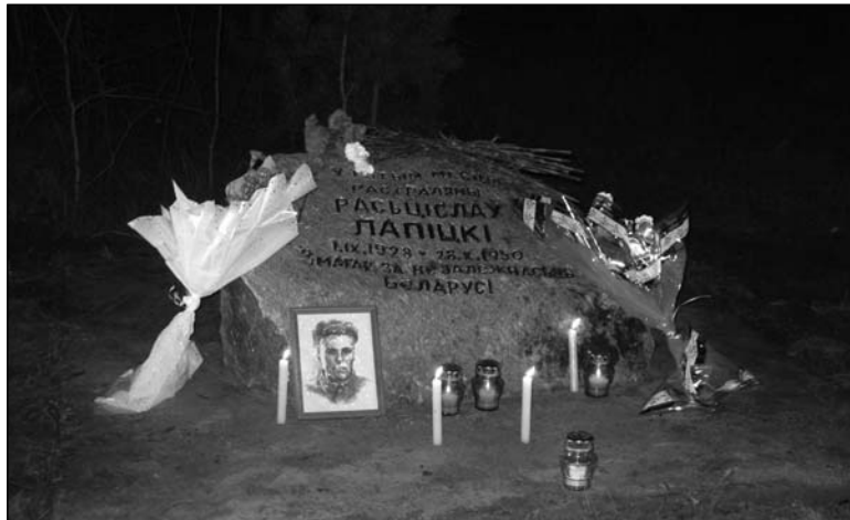
Памятны валун, які знеслі ўлады

Побач знаходзіўся яшчэ адзін крыж — «Ахвярам рэпрэсіяў ад грамадскасці Смаргоні», які сімвалічна ўшаноўваў памяць усіх змагароў за незалежнасць Беларусі, забітых расійскімі, польскімі, нацысцкімі, савецкімі карнікамі, месцы пахаванняў якіх не вядомыя родным і блізкім ахвяраў. Завяршыў народны мемарыял трыццаць крыж, з надпісам «Героям Беларусі», усталяваны 9 верасня 2009 года.