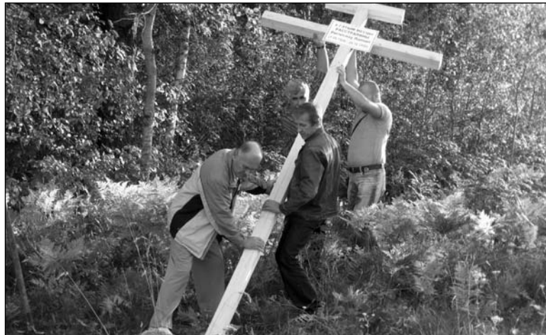
Актывісты ўзводзяць крыж

Чарняўскі разам з іншымі прадстаўнікамі беларускіх супо-