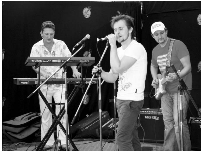
Гурт «У нескладовае»

Гэты сімвалічны жэст стаў сігналам для пачатку музычнай праграмы «Амбулавішча-2010». Гэтым разам, улічваючы няпэўную сітуацыю з месцам правядзення наступнага фэсту, яго ар-