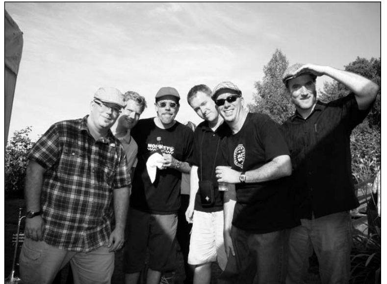
«The Bishops» (ЗША)

ганізатары вырашылі падвесці своеасаблівыя рахункі і запрасілі пераможцаў мінулагадніх «Амбулавішчаў». Распачаць сёлетнюю канцэртную праграму было даручана мінулагоднім пераможцам фэсту — слаўгарадскаму гурту «Хуткі смаўж». Каманда — рэдкі госьць на сталічных канцэртных пляцоўках, і таму было цікава параўнаць узровень музыкантаў «Хуткага смаўжа» цяперашні і мінулагодні.