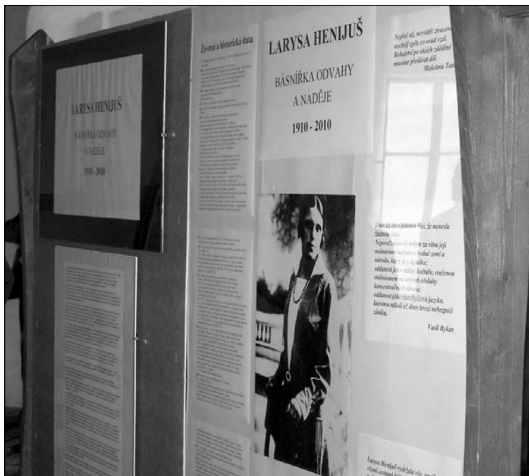
Выстава «Ларыса Геніюш: паэтка адвагі і надзеі»

залю, дзе размешчана экспазіцыя дакументаў, прысвечаных чэшскаму перыяду Геніюш.