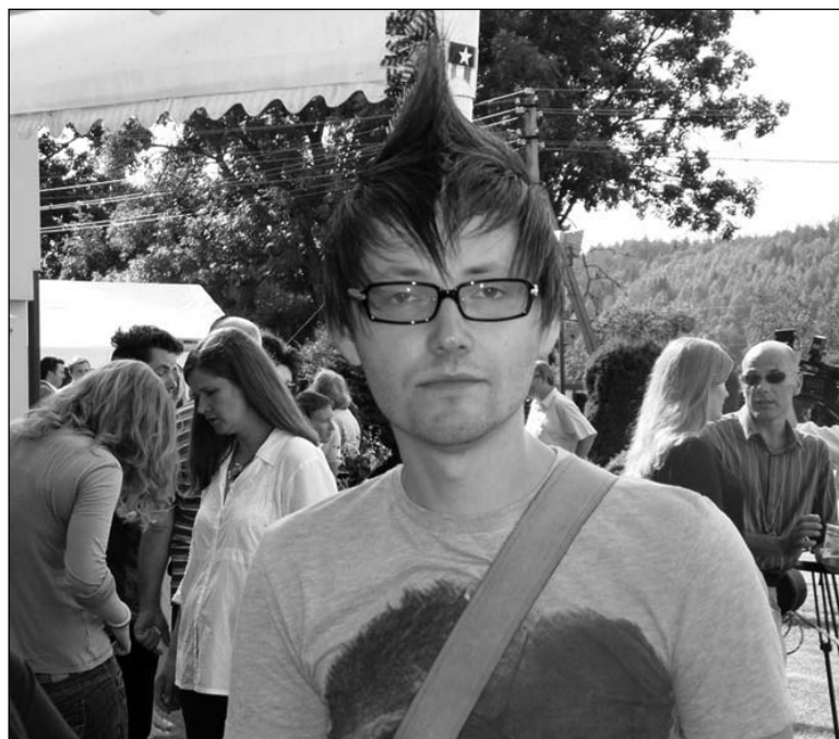
Гурт «Zig Zag»

Пазітыўную хвалю «Амбулавішча» падхапіў наступны госьць фэсту — гурт «Кальмары». Бярозаўскія музыканты парадавалі слухачоў вясёлым драйвам сваіх старых кампазіцый, кштальту «Бадмінтон» і «Яна і я», навінкамі — гумарыстычнай песняй «Імпарт-экспарт». Відавочна,