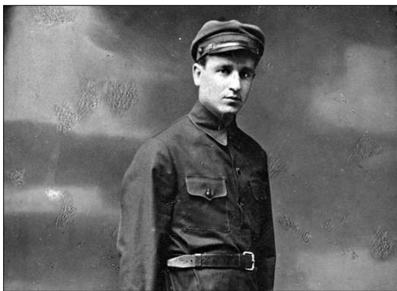
Праведнік свету Мікалай Кісялёў. Быў камандзір партызанскага атрада «Мсцівец», які ў 1942 г. вывёз з в. Далгінава за лінію фронта 218 габрэяў

гісторыі і імёны пяцісот чалавек. Сваім меркаванне падзялілася аўтарка кнігі Іна Герасімава , кандыдат гістарычных навук, дырэктар Музея гісторыі і культуры габрэяў Беларусі.