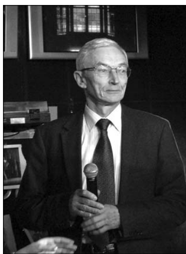
Пасвячэнне ў студэнты ЕГУ-2008. Рэктар ЕГУ Анатоль Міхайлаў

— Думаю, не наша віна, што разумныя людзі з'язджаюць з Беларусі. Мы робім усё магчымае, каб нарасціць крытычную масу тых, хто можа быць карысны Беларусі. Ёсць адна праблема: мы з'яўляемся ўніверсітэтам гуманітарных і сацыяльных навук. У свеце ў цэлым маецца перавытворчасць кадраў у гэтай сферы, і чакаць, што будзе вялікі попыт на спецыялістаў, не варта. Я спадзяюся, што стан негатыўных адносінаў да нашага ўніверсітэта будзе мець свае рамкі і межы. Калісьці, спадзяюся, нарэшце будзе асэнсавана, што прафесіяналізм патрэбны, каб вывесці нашу краіну са стану бяжэнносу, у якім яна знаходзіцца. Адна справа, калі такія людзі ёсць, іншая — калі іх няма ці калі рыхту-