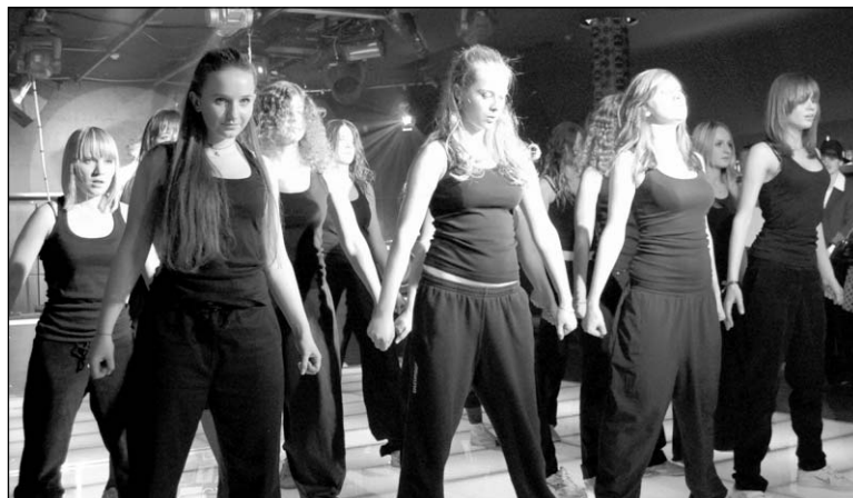
Пасвячэнне ў студэнты ЕГУ-2008

— А вы можаце займацца такімі перакладамі?