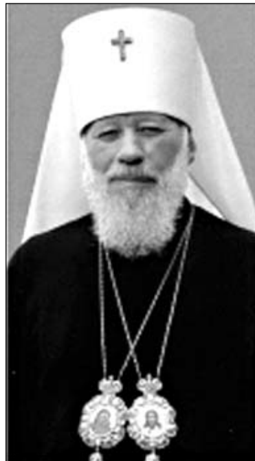
Уладзімір, мітрапаліт Кіеўскі і всея Украіны