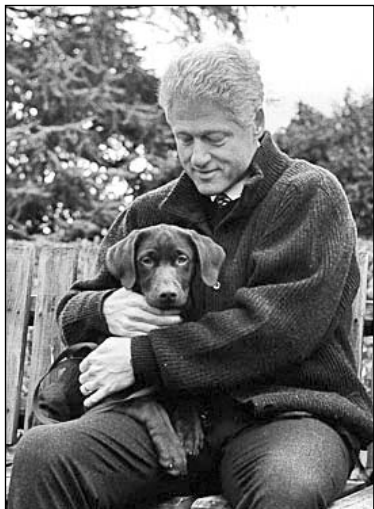
Бадзі сямейства Клінтанаў

Некаторыя сабакі адыгралі вялікую ролю ў палітыцы. Напрыклад, Пушынка — дачка сабакі па мянушцы Стрэлка, якую кіраўнік саветскіх касмічных праграм Сяргей Каралёў разам з Белкай запустіў у космас напярэдадні палёту Гагарына. Пушынка была падараваная Мікітай Хрушчовым прэзідэнту Джону Кенэдзі пасля заканчэння Карыбскага крызісу як сімвал