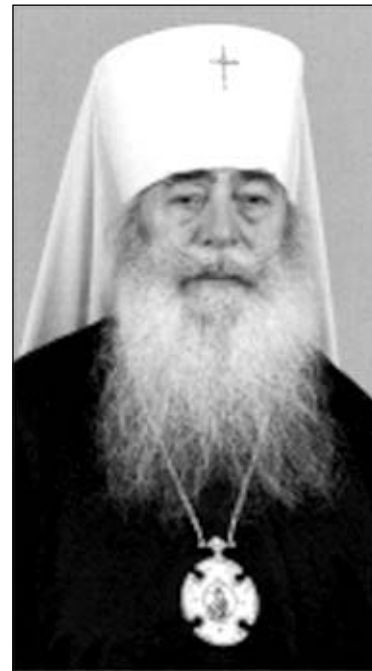
Уладзімір, мітрапаліт Санкт-Пецярбургскі і Ладажскі

Мядзведзевым (галасаваць за якога заклікалі простых прыхаджан). Горш за тое, былі ўхваленыя ганебныя ваенныя кампаніі ў Чачні. Кадравы гэбіст Пуцін раптам зрабіўся вялікім вернікам, жонка Мядзведзева Святлана пачала «рэгулярна бываць на імшах і падтрымліваць усялякія царкоўныя дабрачынныя акцыі».