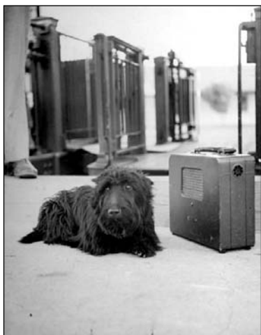
Фала, сабака Франкліна Рузвельта.