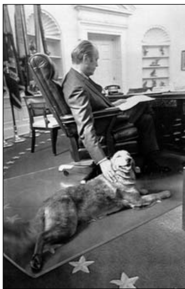
Ліберці, сабака Джорджа Форда

яго пыскі апублікавалі на вокладцы вядомага часопіса Life. Джордальд Форд, калі яго ратвейлер патрабаваў прагулкі, прыпыняў усе дзяржаўныя справы. Барні, сабака прэзідэнта Джорджа Буша-малодшага, быў героем спецыяльнай перадачы. У адной з іх зняўся былы кіраўнік кабінету Вялікабрытаніі Тоні Блэр. Пасля гэтай праграмы да яго, дарэчы, і прыляпілася агідная мянушка — «любімы пудзель Буша».