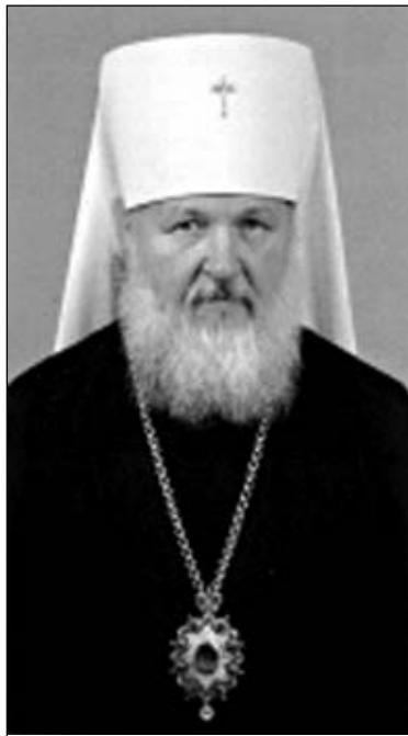
Кірыл, мітрапаліт Смаленскі і Калінінградскі

Алексій II быў вымушаны публічна падтрымаць спачатку Барыса Ельцына, а потым нават Уладзіміра Пуціна з Дзмітрыем