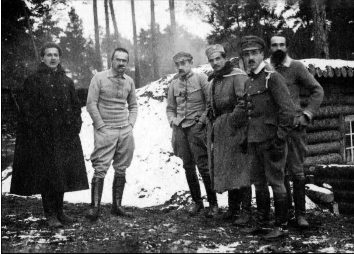
Юзаф Пілсудскі і афіцэры легіёнаў падчас кампаніі на Валыні, 1916

блок супрацоўніцтва з урадам (ББСУ). Фактычна, гэта партыя Пілсудскага. На перамогу блока кінуты фантастычны рэсурс: і грашовы (мільёны золотых), і адміністрацыйны (настаўнікі, чыноўнікі, вайскоўцы). З таго часу палякі жартуюць пра два цуды Пілсудскага: адзін над Віслай і другі — над выбарчай скрыняй.