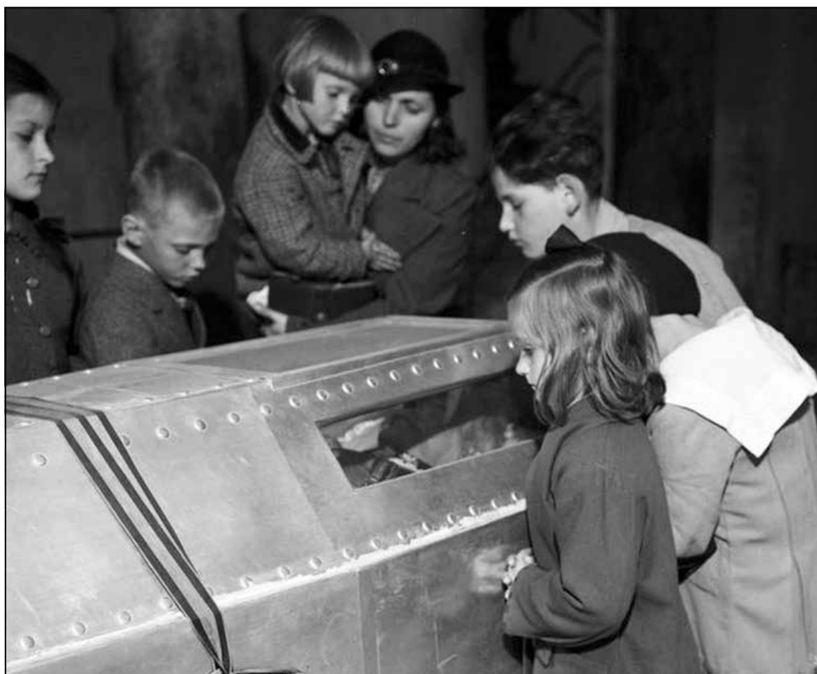
Палякі разглядаюць цела правадыра ў труне, травень 1935

Дзяржава, якая засталася пасля Пілсудскага, мела прыгожае знешняе аздабленне ў выглядзе лозунгаў пра патрыятызм, моц і еднасць, пад якой віравалі сацыяльныя і палітычныя праблемы. Усё гэта стрэліла ў 1939-м, калі ўрад разам з прэзідэнтам... уцёк у Румынію