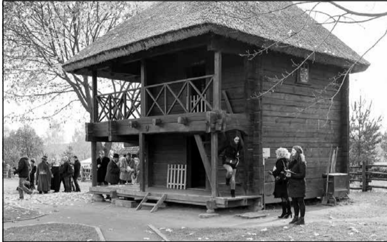
Лямус у Музеі Адама Міцкевіча ў Завоссі

Клець ( камора , кладоўка , спіжарня , свіран ) — паўжылое памяшканне для захоўвання збожжа, прадуктаў, бытавых рэчаў, адзення. Каля сцяны адгароджваліся засекі для збожжа, побач стаялі бочкі, кадоўбы, саламяныя карабы з розным зернем, крупамі, мукой, макам