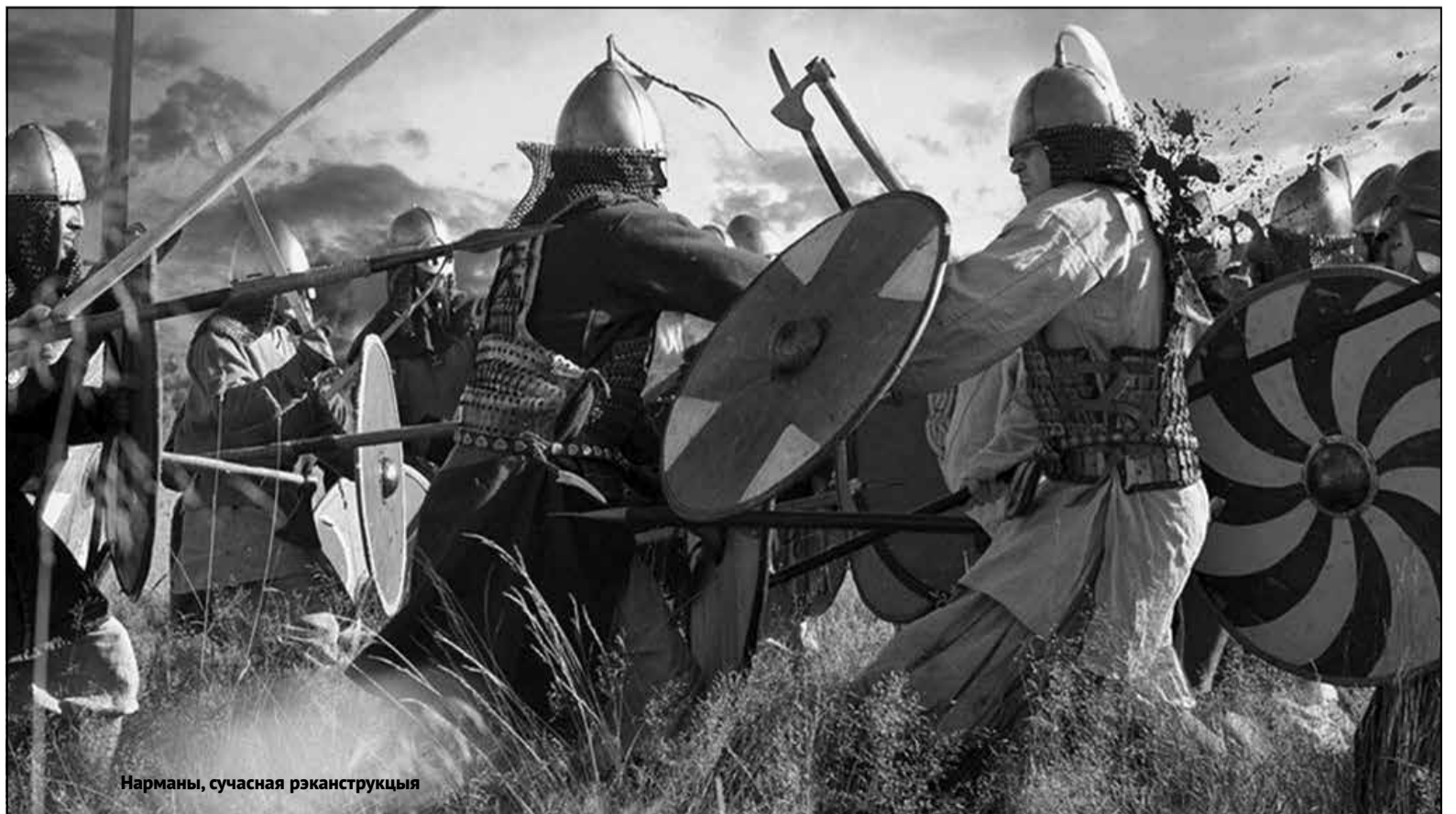
Нарманы, сучасная рэканструкцыя

Барацьба канцэпцыяў, нашых бачанняў мінулага працягваецца. І беларусам трэба адваёўваць тут сваё месца, расчысчаць прастору для свайго варыянта. Інакш, не маючы бачання мінулага свайго, а не навязанага звонку, як мы можам прэтэндаваць на канцэпцыю будучыні?