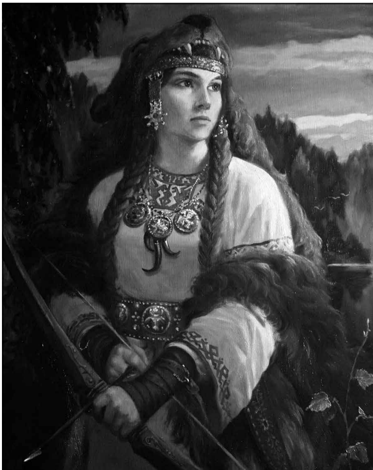
Фантастычныя вобразы даўнейшай Русі ў карцінах Андрэя Шышкіна