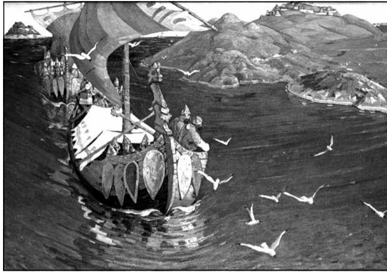
Варагі вачыма мастака Мікалая Рэрыха