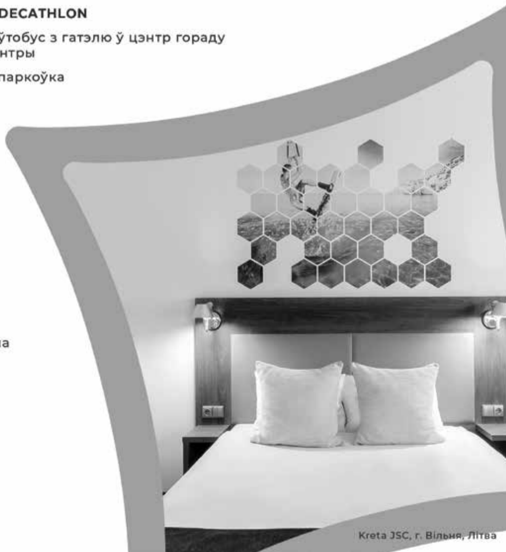
Kreta JSC, г. Вільня, Літва

вул. Мінска (Minsko) 14, Вільня NA076@accor.com +370 5 2032282