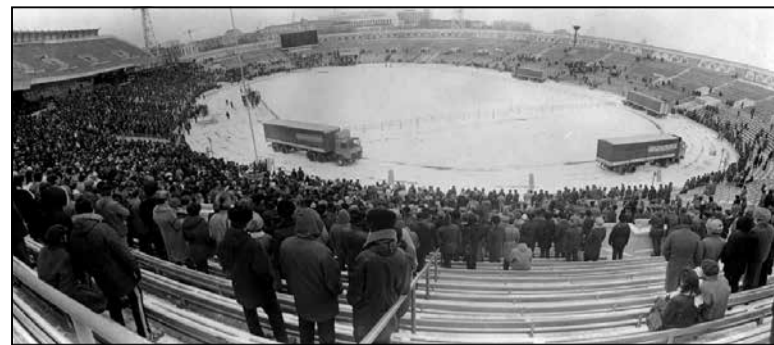
Мітынг на стадыёне «Дынама», 1989 год.

1944. У Маскве нарадзіўся Яўген Будзінас, беларускі пісьменнік, журналіст і бізнесовец. Выгадаваўся ў Вільні. Да літаратуры і журналістыкі працаваў слесарам, цесляром, настаўнікам. Стварыў у 1994 годзе ў Пухавіцкім раёне музей старажытных рамёстваў і тэхналогій «Дудуткі». Там непадалёк і пахаваны.