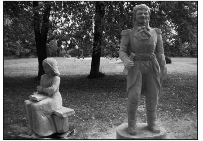
Драўляныя скульптуры Т. Касцюшкі і яго любімай дзяўчынкі Людвікі