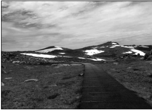
Дарога на гару Касцюшка