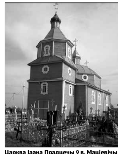
Царква Іаана Праддечы ў в. Маціевічы Жабінкаўскага раёна

Пасля Малых Сяхновічаў мы наведалі старажытную Свята-Мікіцкую царкву ў вёсцы Здзітава, якая была пабудавана на маляўнічым беразе рэчкі Мухавец аж у 1502 годзе. У 1758 годзе ў ёй адпявалі бацьку Тадэвуша