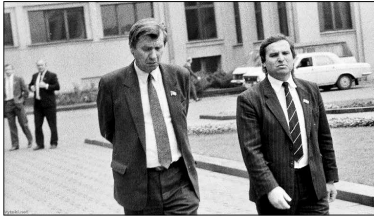
Генеральны пракурор Мікалай Ігнатавіч (злева) з народным дэпутатам Сяргеем Антончыкам. 1991 год. На заднім плане — народны дэпутат Генадзь Карпенка (у чорным гарнітуры).

Шушкевіч спачатку рашуча адмаўляўся, аднак потым прапанаваў перанесці разгляд пытання на заўтра. Але парламенцкая большасць не адступала. Чэпик сцвярджаў, што пры такім раскладзе дэпутаты «подвергнутся ночной обработке». І тут Шушкевіч дапусціў памылку. У спрэчцы з Чэпікам у старшыні, відаць, здалі нервы, і