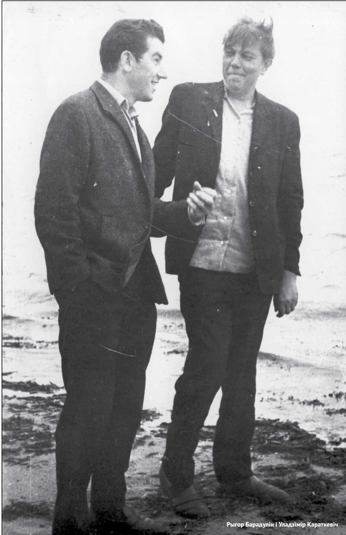
Рыгор Барадулін і Уладзімір Караткевіч

Упершыню «Каласы...» з’явіліся ў 1965 годзе ў лютаўскім-чэрвеньскім нумарах часопіса «Полымя». Праўда, радасці ад таго аўтару было няшмат, бо раман быў надрукаваны не толькі ў скарачаным выглядзе, але дужа знявечаным. Правіў «Каласы...» галоўны рэдактар «Полымя» славуці паэт Максім Танк. Той экзэмпляр «Каласоў...» па сёння захоўвае паметы Яўгена Іванавіча: «Калі ўжо гэта скончыцца!», «Страшэнна ўсё зацягнута», «Гэта трэба скараціць!», «Скараціць!!», «Скараціць!!!» І следам каліграфічна-ўборыстым