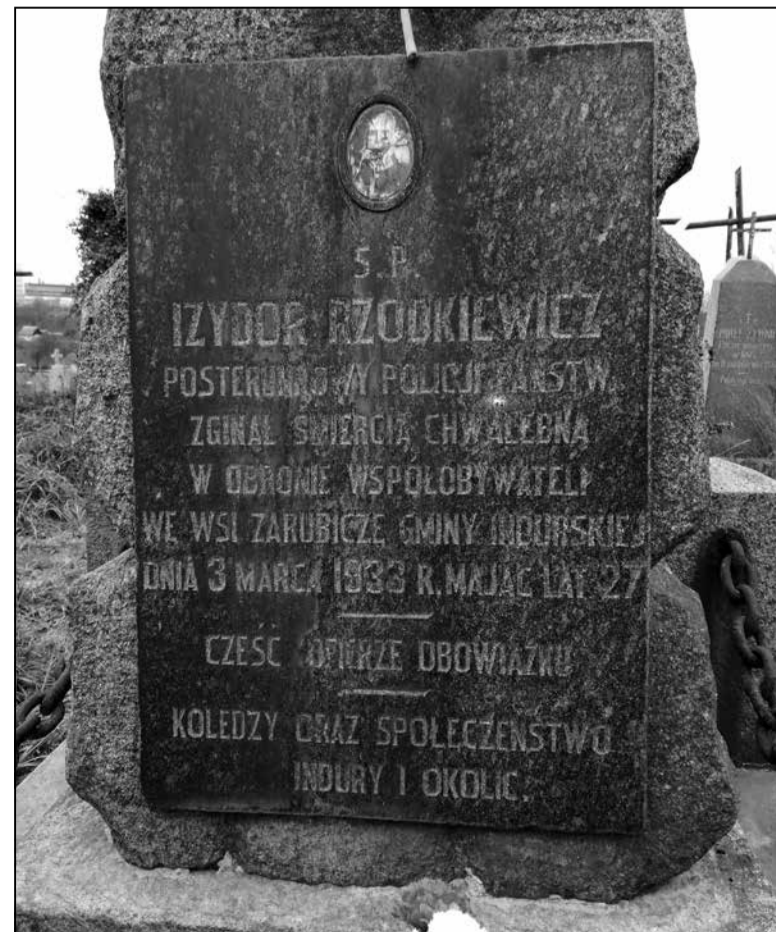
Магіла Ізідора Жадкевіча