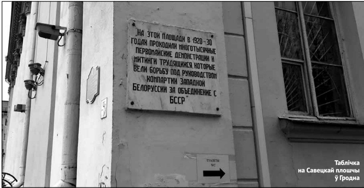
Таблічка на Савецкай плошчы ў Гродна

У чэрвені 1930 года Міністэрства ўнутраных спраў Другой