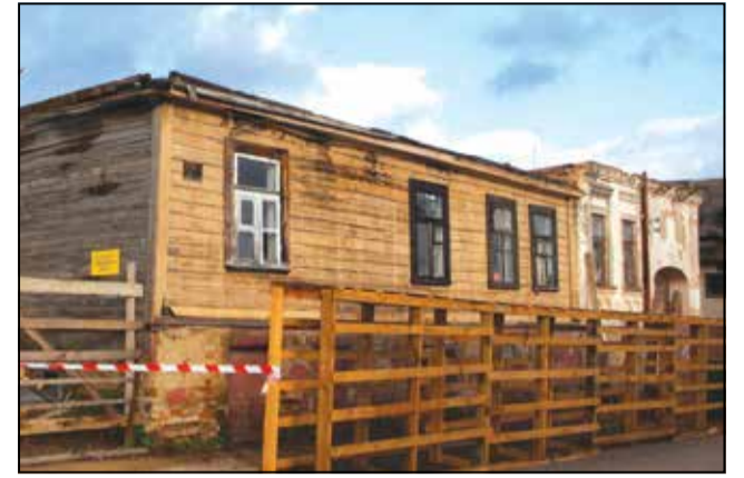
Камяніцы на Віленскай, 33 і 37