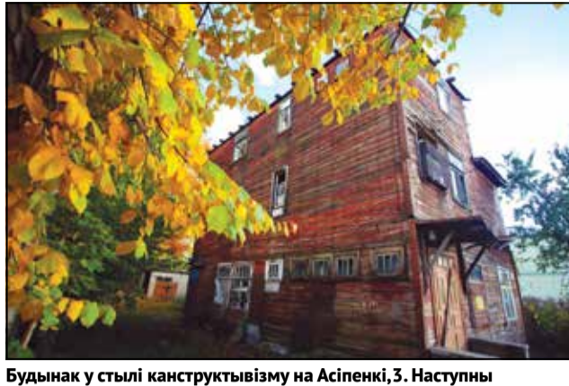
Будынак у стылі канструктывізму на Асіпенкі, 3. Наступны кандыдат пад знос