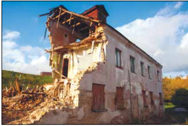
Зруйнаваны будынак на Падольнай, 48