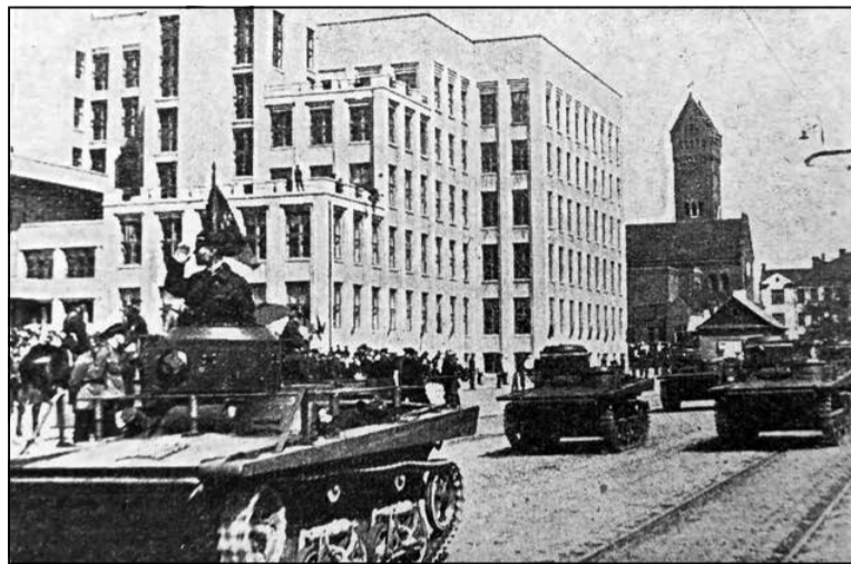
Савецкі парад ля Дома ўраду, 1930-я гады