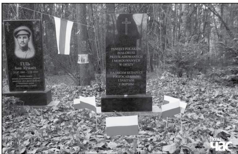
Новы помнік рэпрэсаваным палякам (справа)

Летась мясцовыя актывісты дамагліся ад Аршанскага выканкаму ўсталявання на Кабыляцкім камяні памятнай шыльды з надпісам «Месца памяці і смутку» на чатырох мовах: беларускай, рускай, ідыш і... англійскай. Хаця замест апошняй павінна была быць польская. Па-першае, менавіта гэтыя чатыры мовы разам з польскай былі дзяржаўнымі ў 1920–1930-я гады ў БССР.