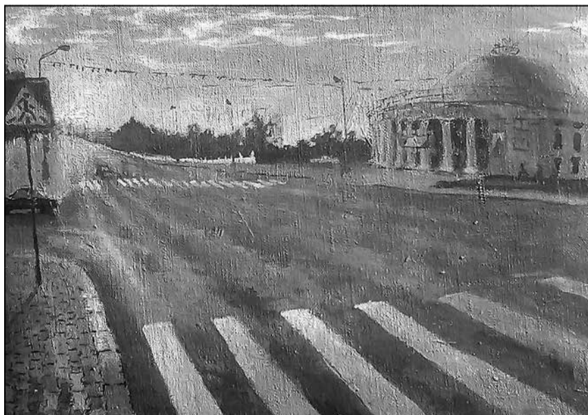
Цырк на праспекце Незалежнасці