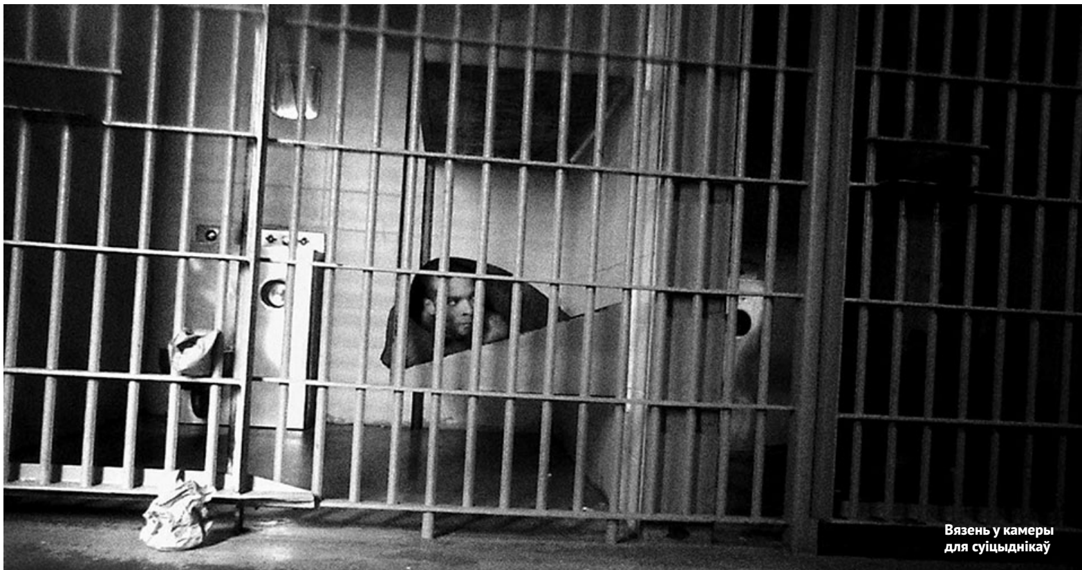
Вязень у камеры для суіцыднікаў