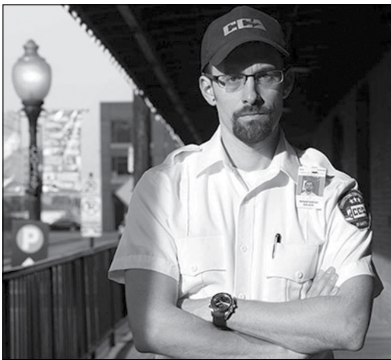
Шэйн Баўэр, аўтар расследавання

«Ці ведае хто, чаму мы не хочам, каб яны мелі індывідуальнае адзенне?» — пытае нас Паркер. «Мы хочам, каб яны былі ўпарадкаваныя (institutionalized). Ніколі не чулі такі тэрмін? Мы хочам, каб яны былі ўпарадкаваныя, а не індывідуалізаваныя. Нейкая псіхалагічная гульня? Так. Але ведаеце што? Гэта працуе ўсе тыя некалькі соцень гадоў, што ў нашай краіне ёсць турмы. Вось чаму мы так робім. Мы не хочам, каб яны адчувалі сябе як індывідуумы. Мы хочам, каб яны — не