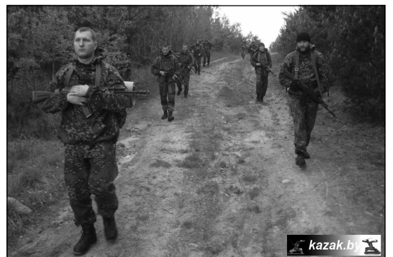
Байцы парамілітарнага фарміравання «Казачий Спас» у Беларусі

У наступнай частцы мы працягнем раскрыццё звестак пра прадстаўнікоў сілавога блоку расійскай амбасады ў Беларусі, а таксама непасрэдных рэалізатараў расійскай стратэгіі «мяккай сілы» ў нашай краіне.