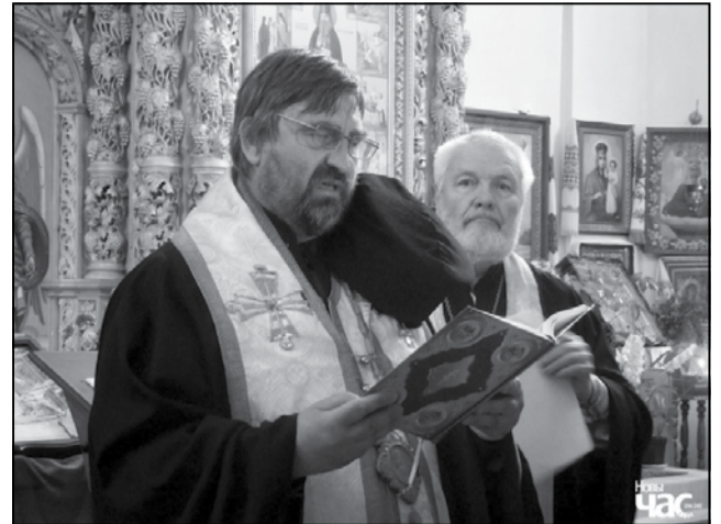
З кіраўніком БАПЦ архіепіскапам Святаславам (Логіным) падчас набажэнства ў Кацярынінскай царкве Чарнігава, жнівень 2019 года