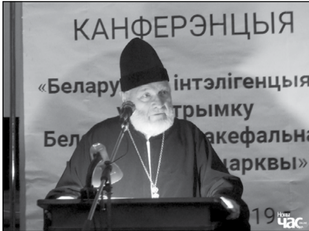
Леанід Акаловіч на канферэнцыі ў падтрымку беларускай аўтакефаліі ў Чарнігаве, жнівень 2019 года