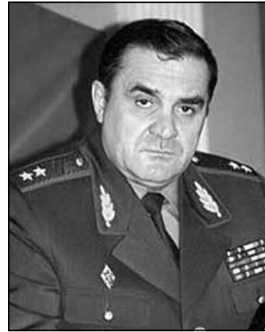
Генерал Уладзімір Усхопчык