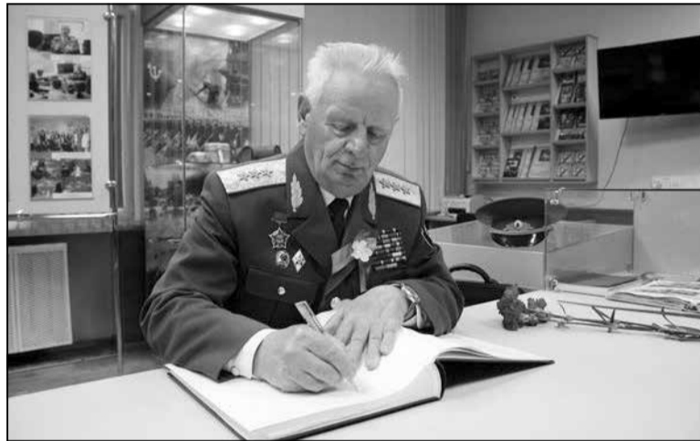
Генерал Пётр Чавус