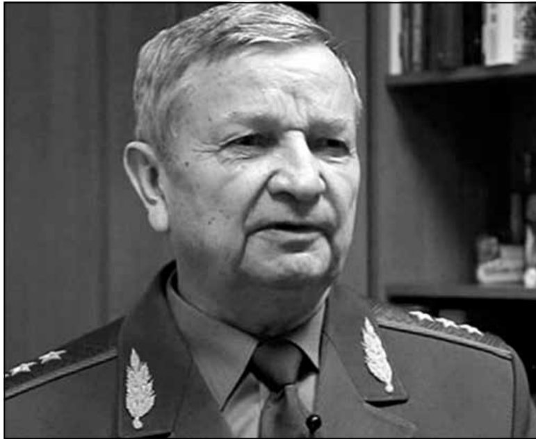
Міністр абароны Рэспублікі Беларусь у 1992–1994 гадах Павел Казлоўскі

24 сакавіка 1992 года дэпутат Вярхоўнага Савета 12 склікання Генадзь Лавіцкі (з лютага па ліпень 1994 года — шэф КДБ) апублікаваў у «Народнай газеце» артыкул, у якім разважаў