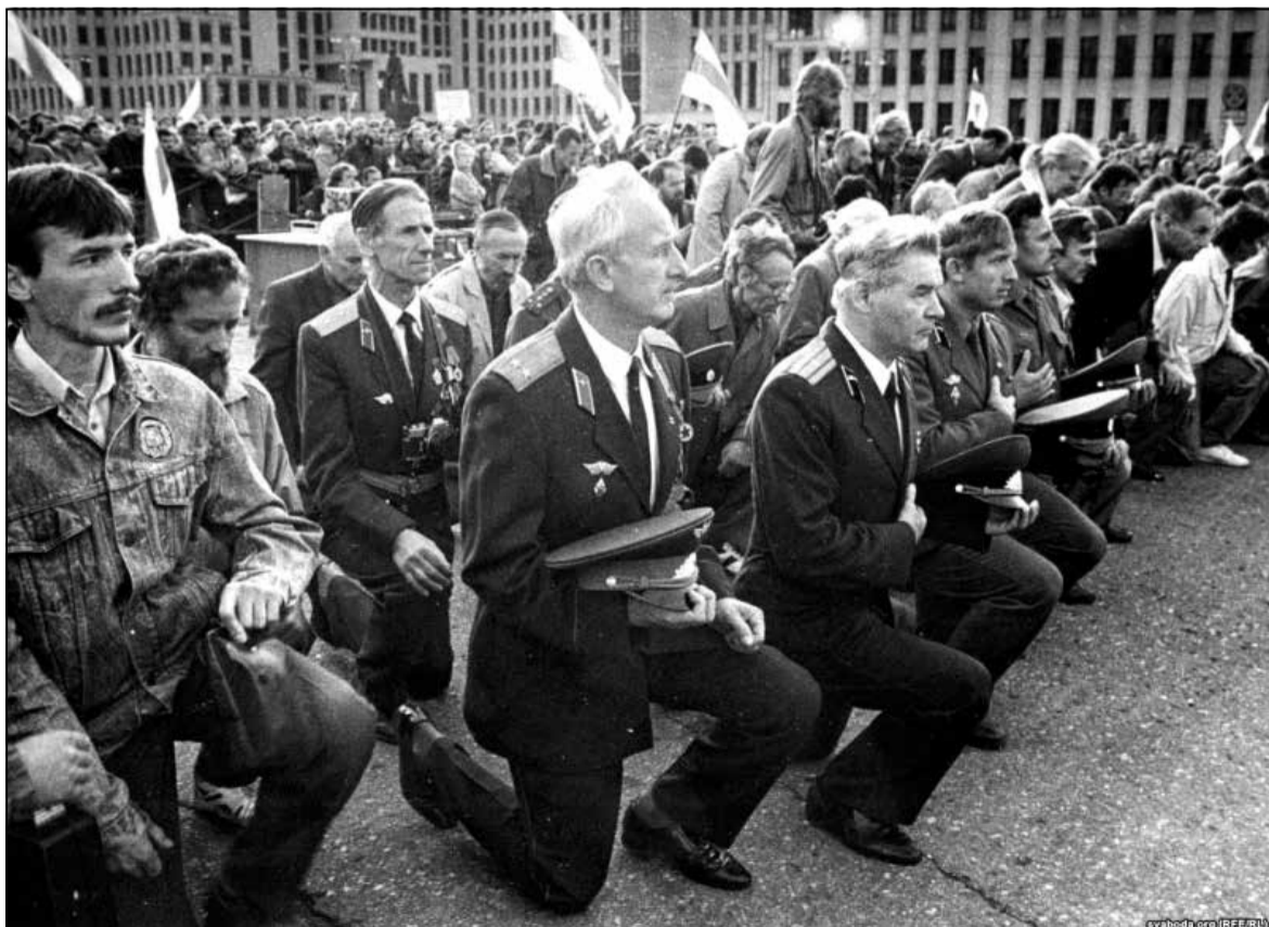
Прысяга на плошчы Незалежнасці ў Мінску 8 верасня 1992 года

Але найпершая праблема была ў раскраванні вайскавай маёмасці, тэхнікі і зброі. 29 мая 1992 года «Народная газета» выйшла з такім заглаўкам на першай паласе: «Если у Министерства обороны Беларуси