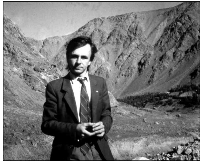
У гарах Паміра, савецка-аўганская мяжа, Горны Бадахшан. 1989 год