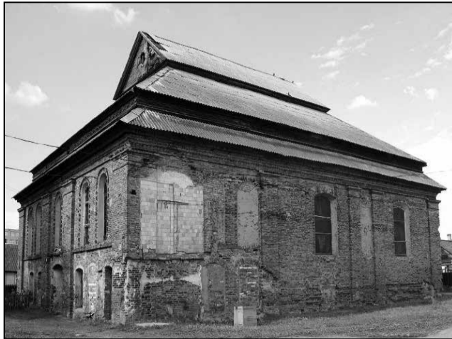
Будынак сінагогі ў Ашмянах.