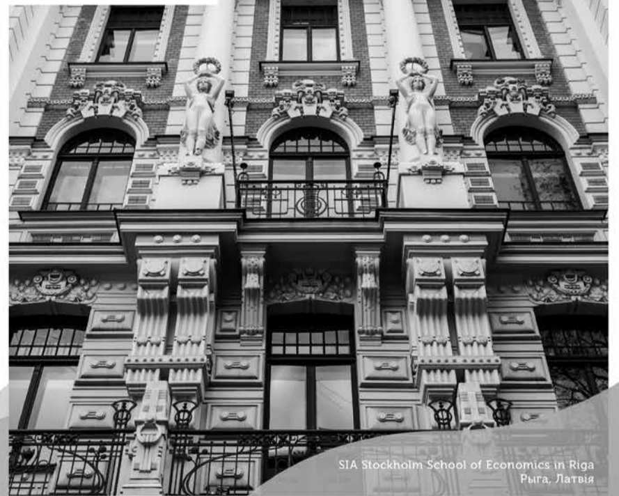
SIA Stockholm School of Economics in Riga Рыга, Латвія