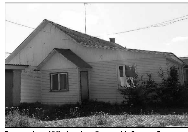
Будынак сінагогі ў Калінкавічах.

Актывісты спрабавалі надаць будынку статус гісторыка-культурнай каштоўнасці, аднак вердыкт навукова-метадычнай Рады пры Міністэрстве культуры быў наступны: «Недастаткова матэрыялаў для ўзяцця аб'екта пад ахову дзяржавы».