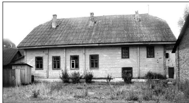
Будынак сінагогі ў Івянцы.

Лепельская сінагога 1918 года пабудовы цяпер прыстасаваная пад жылло для сямі ці васьмі сям'яў. Адна з кватэр, з так званымі «вокнамі-антрэзолямі», зробленая на месцы галерэі, дзе маліліся жанчыны.