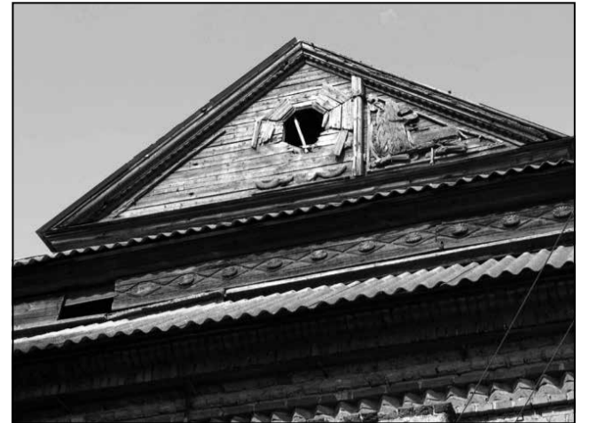
Фасад ашмянскай сінагогі.

нагогі арэалу ўсходняй Еўропы вылучаліся арыгінальнасцю і спецыфічнай архітэктурай у той час, як у Цэнтральнай і Заходняй Еўропе іх асаблівасці не набылі такога яркага праўлення.