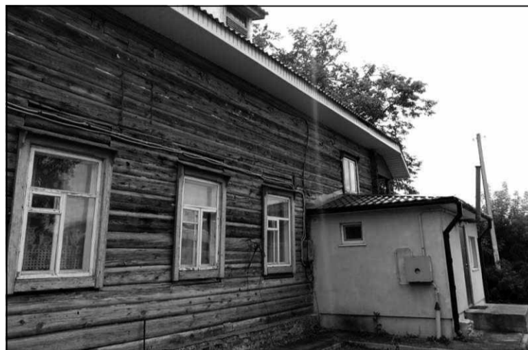
Будынак сінагогі ў Лепелі.

Івянецкая сінагога была ўзведзена ў 1912 годзе. Пасля Другой сусветнай вайны яе перабудавалі — атынкавалі паўднёвы фасад. Да 2009-га сінагога выкарыстоўвалася як