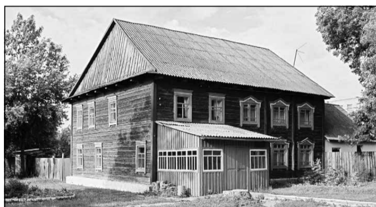
Будынак Малой сінагогі ў Любані да рэканструкцыі.

рэпетыцыйнай зала, а з 2015-га тут працуе будаўнічая крама. На сцяне ўнутры будынка захаваўся адзіны ў Беларусі малюнак арон кодэша (каўчэг для скруткаў Торы) у тэхніцы ілюзорнага жывапісу.