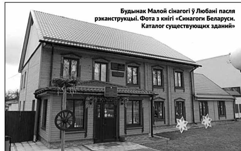
Будынак Малой сінагогі ў Любані пасля рэканструкцыі.