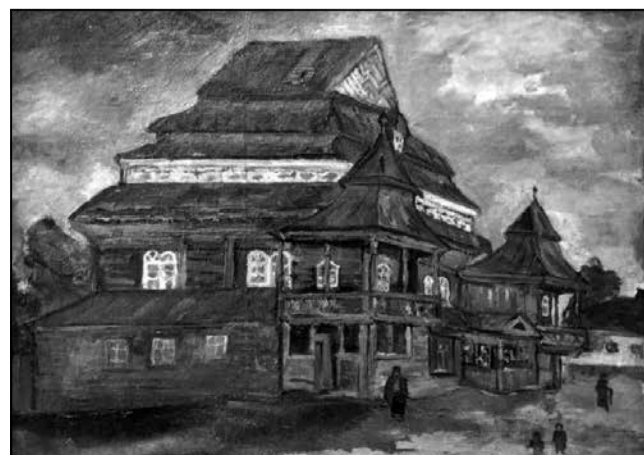
Сінагога ў Нароўлі, 1927 г. Мастак А. Р. Касцялянскі