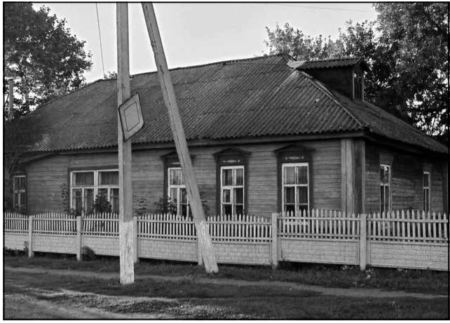
Будынак сінагогі ва Уваравічах (Буда-Кашалёўскі раён). Знесеная ў 2014 годзе.