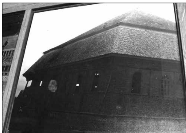
Фота сінагогі ў Цярэспалі. Музей габрэяў у Парыжы