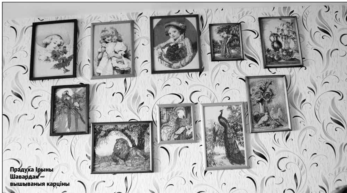
Прадуха Ірыны Шавардак — вышываныя карціны