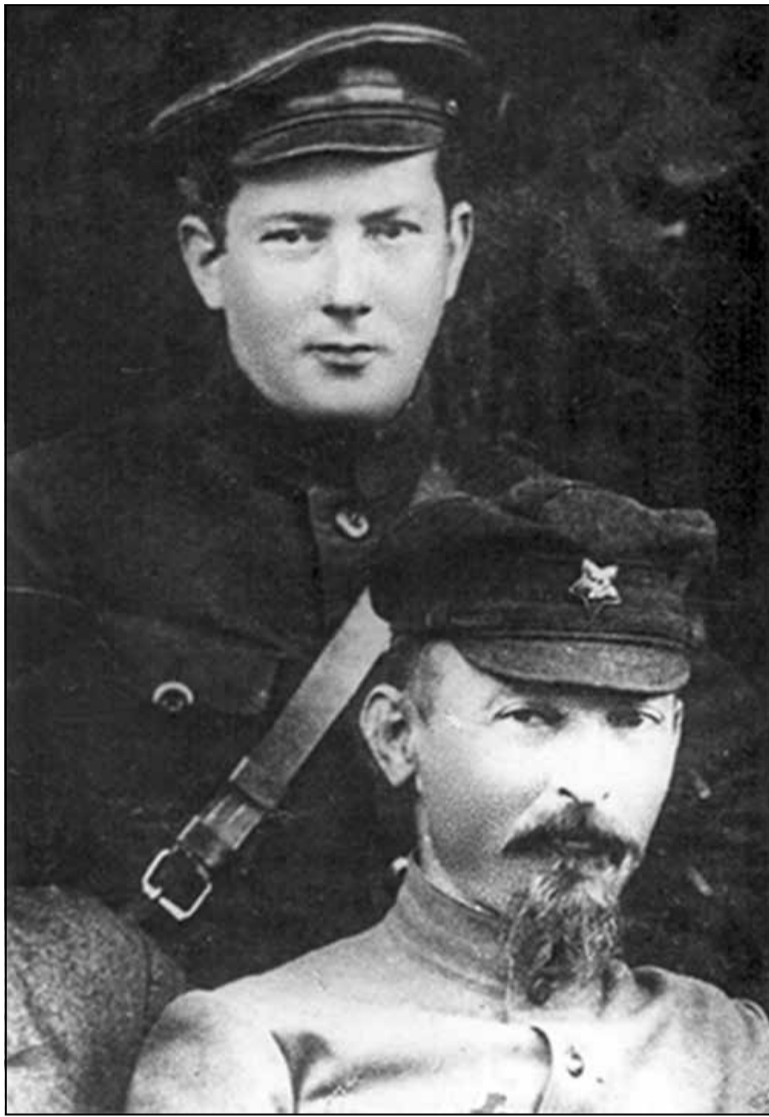
Ігнацы Візнер — упаўнаважаны ВЧК у Бранску разам з Феліксам Дзяржынскім, 1918–1919 г.

На Старажоўцы жылі маці і брат зяленадубца Мікалая Крывашэна — Карча, якія былі вельмі радыя атрымаць звесткі пра свайго малодшага і падарунак, багаты па тых часах, — скурачныя боты. Гасціннасцю Крывашэных часцяком карысталася Ганна. Яны ведалі яе як Маню Зайцаву. Георгій, які меў доступ да армейскіх матэрыялаў, дапамагаў таксама ў зборы інфар-