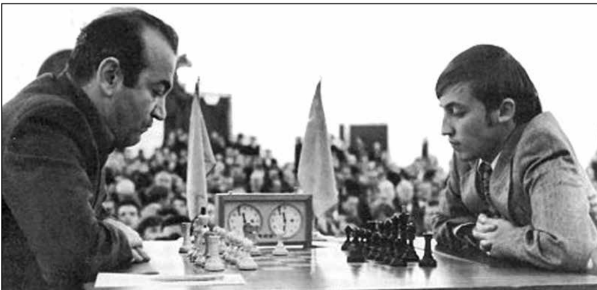
Матч прэтэндэнтаў на першыства свету ў 1974 годзе паміж Віктарам Карчным з Анатолям Карповым. 2 гады да ўцёкаў

У любым выпадку, для сацыял-дэмакратаў апошнія апытанні можна назваць прамежкавым поспехам: партыя не першы год спрабуе выйсці з крызісу, выкліканага занадта доўгім знаходжаннем у кіруючай кааліцыі з CDU у ролі малодшага партнёра. Калі партыя сыдзе ў апазіцыю, то з такім лідарам, як Шольц, яна мае шанцы вярнуцца да ўлады на наступных выбарах.