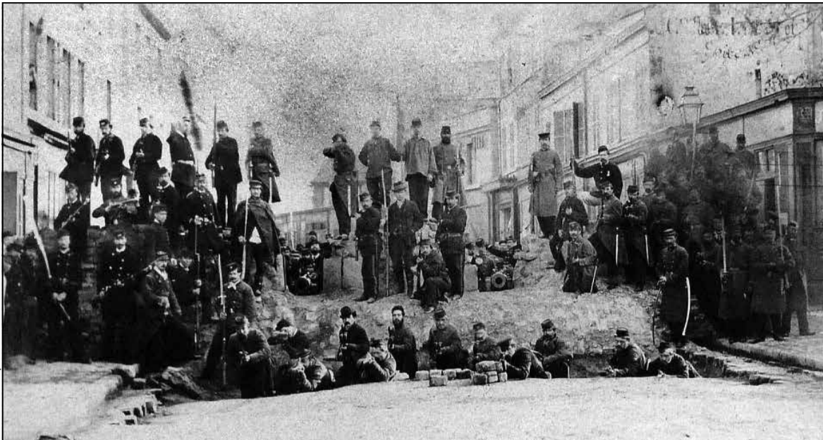
Барыкада Парыжскай Камуны каля могілак Пер-Лашэ

29 красавіка пад Валілай атрад Духінскага сустрэў першы бой з царскімі войскамі, якія больш чым удвая пераўзыходзілі сілы паўстанцаў, і атрымаў цяжкую паразу: 32 чалавекі забітыя, страчана казна і пячатка ваяводы Духінскага. Царскія карнікі нават адрапартавалі аб гібелі «збеглага падпаручніка Урублеўскага». Але капітан Урублеўскі застаўся жывы і не падаў духам. І неўзабаве ў Ружанскім лесе адбыўся парад усіх паўстанцкіх сіл Гродзеншчыны — шэсць тысяч штыкоў. Доклад-