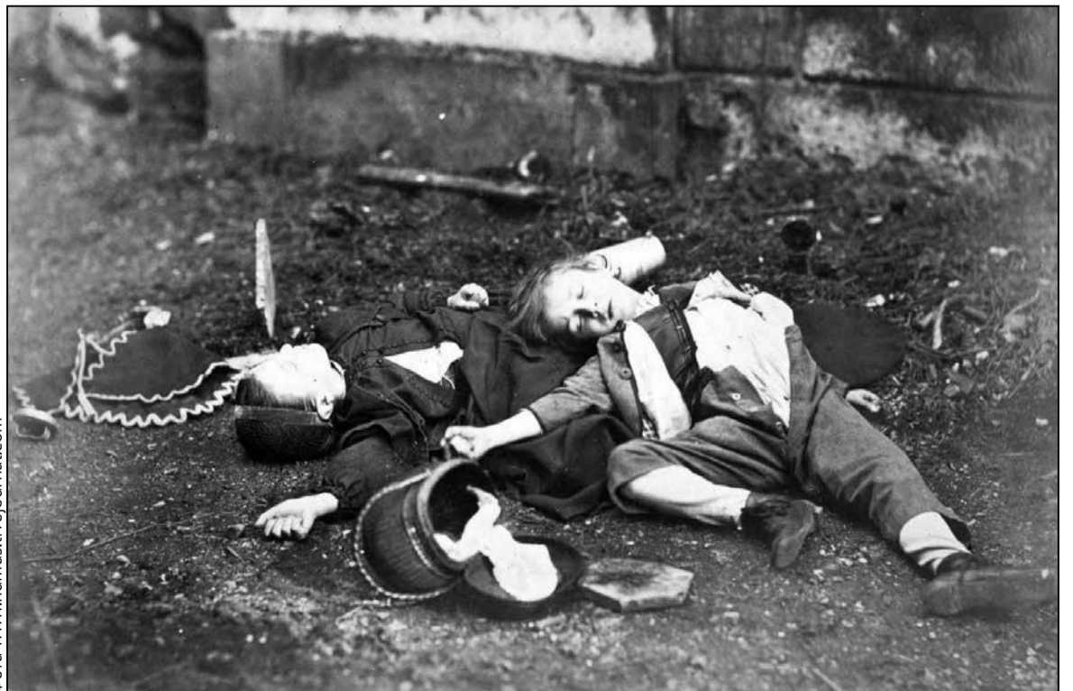
Дзці, якія загінулі пры абстрэле падчас аблогі Парыжа

Дык кім жа ён быў, Валерый Антоні Урублеўскі? Паўстанец і генерал, які змагаўся за Польшчу, Беларусь і Францыю? І — новую, народную Расію. Напэўна, яго жыццё нельга падзяліць дзяржаўнымі межамі. Бо ён сам з лёгкасцю пераходзіў любыя кардонны, каб змагацца за свабоду і справядлівасць усюды, дзе білася яго адважнае і чыстае сэрца.