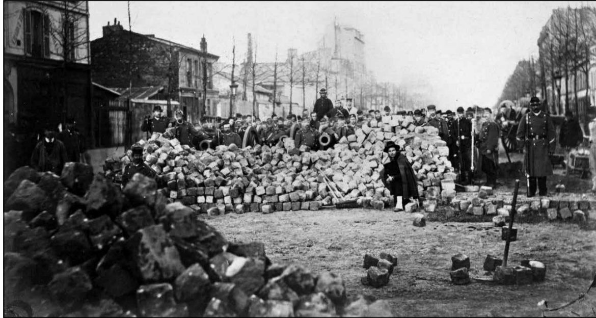
Барыкады на вуліцы Германіі і Севастопаль

У Францыі Урублеўскі і Дамброўскі сталі на чале левага крыла польскай эміграцыі. А ў 1870 годзе пачалася франка-пруская вайна, выкліканая майстэрскай дыпламатычнай інтрыгай канцлера Бісмарка. Царская Расія ў гэтай вайне фактычна падтрымлівала найбольш рэакцыйную прускую манархію. Армія Напалеона III, нягледзячы на фанфаронства яе генералаў, і нават перавагу французскіх ігольчастых вінтовак Шаспо над прускімі Дрэйзе, займела поўную паразу. Пасля звяржэння Банапарта эмігранты з Польшчы і Беларусі масава сталі на абарону Французскай рэспублікі. Але старыя генералы на чале новага ўрада «нацыянальнай абароны» зусім не прагнулі дапамогі патрыётаў-рэвалюцыянераў.