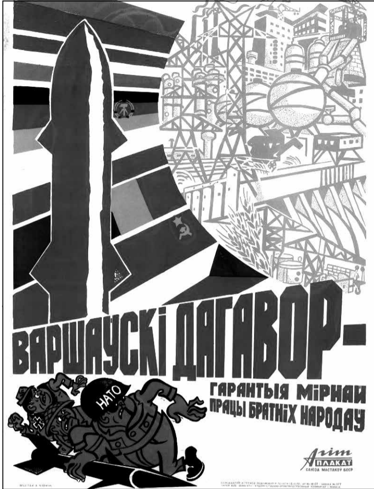
Варшаўская дамова. Савецкі агітацыйны плакат часоў БССР.

Моцная прапагандысцкая машына БССР была кінутая на тое, каб даказаць насельніцтву і грамадскасці неабходнасць