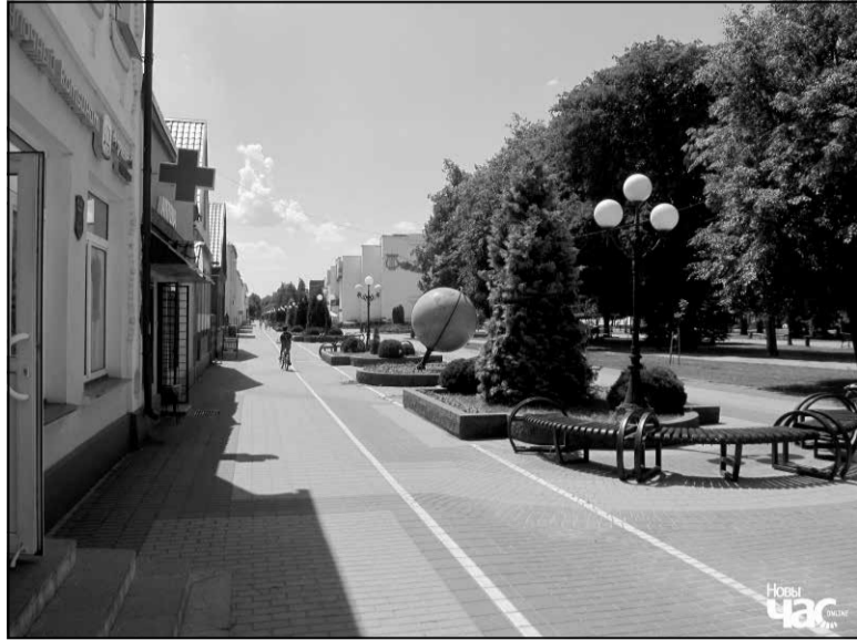
Былая вуліца Траўгута ў Кобрыве (сучасная імя Аляксандра Суворова)

тым прыняў пасаду дыктатара пад мянушкай Міхал Чарнецкі. Менавіта на гэтай пасадзе наш герой зацвердзіў Кастуся Каліноўскага кіраўніком паўстання ў Літве.