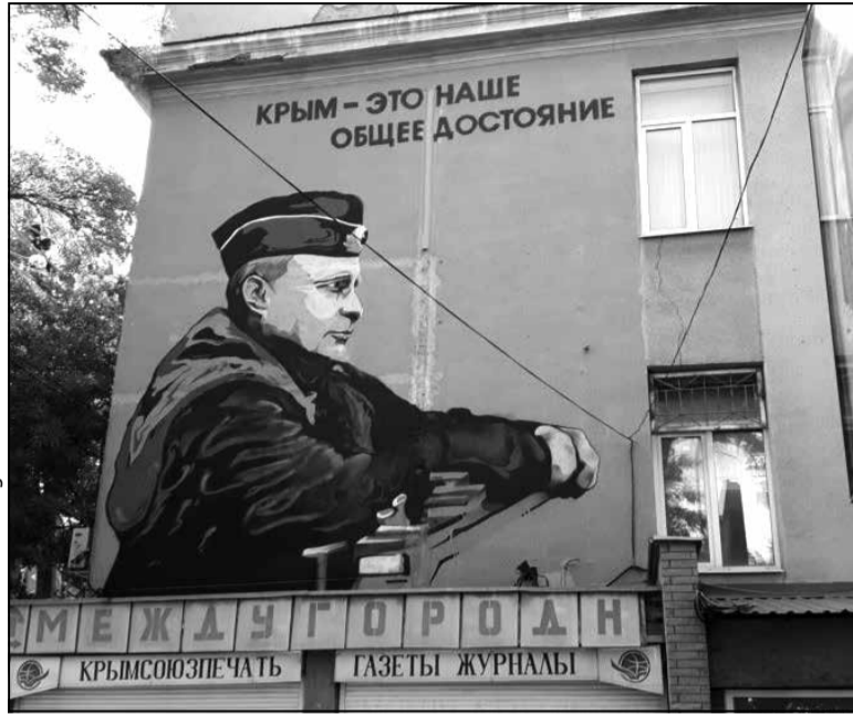
Графіці з выявай Уладзіміра Пуціна ў Сімферопалі

Супрацоўнікаў ФСБ цікавіла, адкуль узятая ідэя заехаць