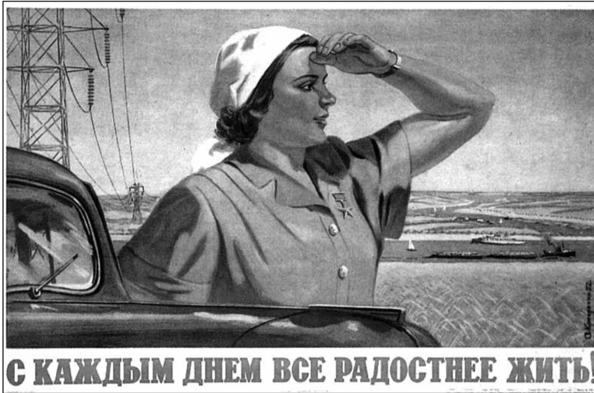
С КАЖДЫМ ДНЕМ ВСЕ РАДОСТНЕЕ ЖИТЬ!

Актывісты рабочага руху ад самага пачатку выступалі супраць кантрактнай формы найму.