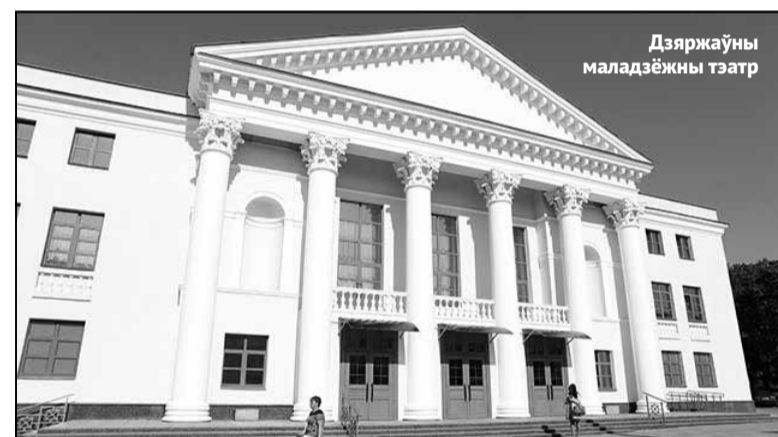
Дзяржаўны маладзёжны тэатр