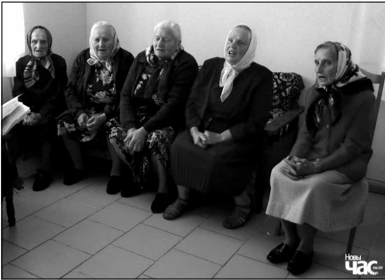
Выканальніцы лірычных песень, «Малёўскі фальклорны гурт» в. Карцэвічы Нясвіжскага раёна Мінскай вобласці.

Вобраз долі — другі паводле частотнасці. Лірычныя песні сфакусаваныя на пытанні пра гэту быццёвую катэгорыю, канстанту і каштоўнасць, якая факусуе ў сабе ўсе астатнія. У той жа час, фатальнасць лёсу не абсалютная: долю, дадзенаю ад нараджэння, можна змяніць у вузлавыя моманты жыцця (вяселле). У лірычных песнях добрая доля звязваецца з заключэннем удалага шлюбу, узаемным каханнем. Нядоля для мужчыны — гэта рэкруцкі набор, салдацкая служба, ад'езд на чужыну, а для жанчыны — страта вянку, які сімвалізуе цнатлівасць, а таксама няўдалы шлюб (са старым, нялюбым). Доля дзяўчыны, што выходзіць