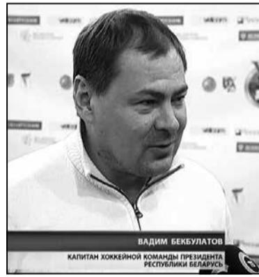
Скрыншот відэа телеканалу «СТВ»