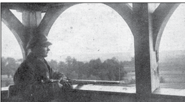
Памежнік КАП. 1930-я гады

Нянавісць да тэрарыстычнай палітыкі бальшавіцкіх камісараў накіравала беларускія сімпатыі ў бок Польшчы. [...] Сёння больш, чым калі б тое ні было, стала ясна, што не толькі Беларусь і Украіна не змогуць стварыць незалежнасць і ўтрымаць яе, не толькі Літва, Латвія, Эстонія, але і Польшча і Фінляндыя не змогуць утрымацца, калі ўсе гэтыя дзяржавы не змогуць устанавіць моцны саюз», — адзначаў беларускі палітычны дзеяч у праграмным артыкуле.