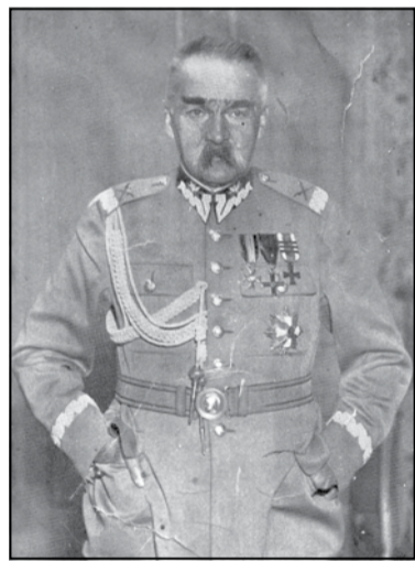
Юзаф Пілсудскі, 1930-я гады

царская Расія, а ўжо ў 90-х гадах (маюцца на ўвазе 1890-я. — Рэд.) Беларуска сацыялістычная грамада прадставіла праграму незалежнасці Беларусі ў федэрацыйным саюзе з этнаграфічнай Літвой з сумеснай сталіцай у Вільні. Ужо тады было зразумела, што толькі разам з іншымі панявольенымі народамі Беларусь зможа дамагчыся права на свабоду, і толькі ў сувязі з імі гэтую свабоду атрымаецца захаваць. [...] Беларускі селянін, які не ведае, што такое маскоўская «абшчына», які з'яўляецца прыхільнікам індывідуальнай гаспадаркі і жадае валодаць зямлёй як уласнік. Ён ніколі не пагодзіцца на камуну, не верыць у яе магчымасці, з'яўляецца станоўчым ворагам камуністычнай сістэмы і панавання камісараў. Пасля цяжкай вайны, якую, як лічыць народ, «прыдумаў цар», пасля цяжкай нямецкай акупацыі, пасля дзікіх бальшавіцкіх эксперыментаў да сялян прыходзіць разуменне, што «мы павінны самі кіраваць у сваім краі». Бальшавікі, якія ў разуменні псіхалогіі мас не маюць сабе роўных, ідуць на сустрэчу гэтым настроям — 1 студзеня 1919 года выдаюць маніфест часовага працоўна-сялянскага ўраду савецкай Беларусі». [...]