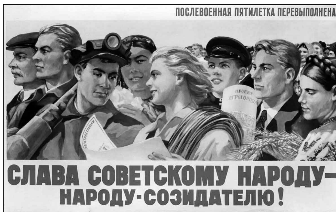
ПОСЛЕВОЕННАЯ ПЯТИЛЕТКА ПЕРЕВЫПОЛНЕНА!

Для нацый ва ўсе часы характэрныя не столькі агульнасць эканамічнага жыцця, колькі агульнасць сэнсу жыцця, які выходзіць за межы задавальнення фізіялагічных і бытавых патрэбаў людзей. Калі гэты агульны сэнс ёсць, то ёсць і нацыя; калі яго няма, то пры ўсіх прыкметах нацыі маецца не народ, а насельніцтва