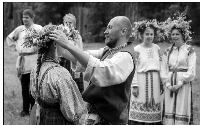
Пятрок у вёсцы Шыпілавічы Любанскага раёна.

Падчас святкавання Пятра ў Любанскім раёне дзяўчаты і жанчыны зрывалі з мужчын і хлопцаў шапкі і кідалі іх у вогнішча. Такое сімвалічнае падкрэсліванне жаночай улады. У той жа час, дзяўчына магла выбраць любога хлопца і надзець