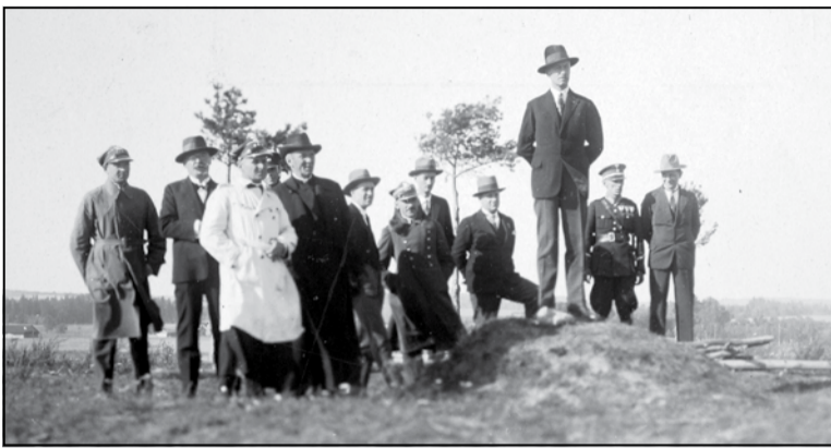
Польскія чыноўнікі і вайскоўцы назіраюць за Мінскам. 1930-я гады. Душкава

Праметэйскі рух меў вялікі вайсковы патэнцыял, які Другая Рэч Паспалітая не змагла выкарыстаць. Польскі Галоўштаб нават не звяртаў увагу на магчымасць стварэння нацыянальных беларускіх і ўкраінскіх падраздзяленняў у сваім войску