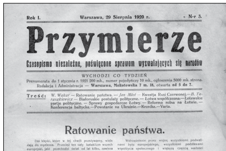
Тытул часопіса «Przymierze»