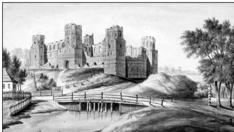
Мірскі замак. Рэзідэнцыя графаў на Міры, гравюра Напалеона Орды

Ганаровыя графскія тытулы Святой Рымскай імперыі датычыліся і канкрэтных уладанняў. Разам з асабістымі тытуламі ў Вялікім Княстве Літоўскім з'явіліся спадчыныя тытулы маёнткаў. Так, у адным шэрагу з валасцямі і староствамі на абшарах краіны, дзе калісьці панавалі княствы, з'явіліся так названыя імперскія графствы. Маёнткі з тытуламі асабліва не вылучаліся пэўнай спецыфікай уладкавання ці кіравання імі, яны былі часткай буйных зямельных уладанняў магнатэрыі. Нададзены імператарам тытул графа меў абавязковую тэрытарыяльную прывязку. Як адзначалася ў дыпламах аб наданні тытула, выдзенага новаспечанаму графу ад рымскага цэзара, тытул узвышаў маёнтка ў статусе. Гэта было яскравым паказчыкам геаграфічнай лакалізацыі тытула, яго прывязкай да галоўнага рэсурсу магната — зямельных уладанняў. Цэнтры маёнткаў з тытуламі станавіліся ядром