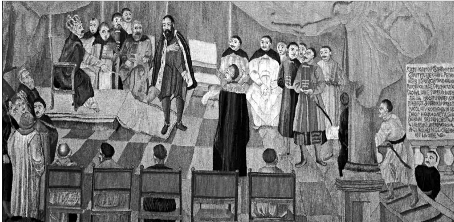
Наданне княжацкага тытула князю Мікалаю Радзівілу Чорнаму (габелен з экспазіцыі ДУ «Нацыянальны гісторыка-культурны музей-запаведнік "Нясвіж"»)