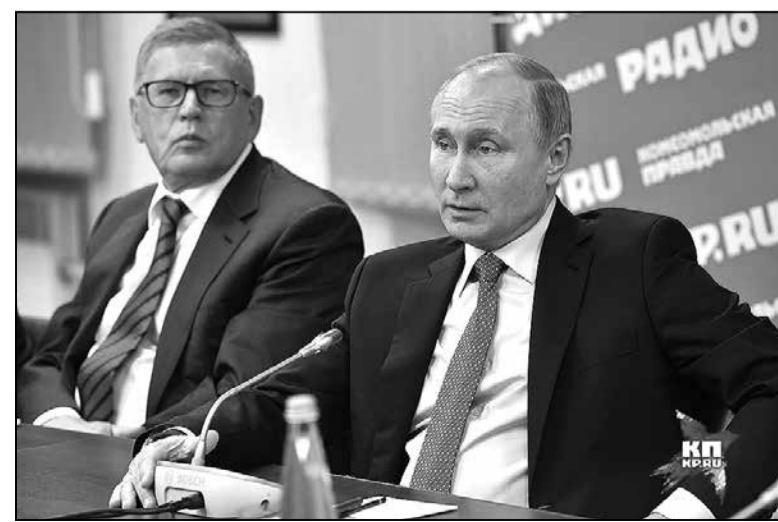
Галоўны рэдактар «КП» Сунгоркін і кіраўнік РФ Пуцін

У лютым 2019 года «Формат-А3» правёў у Крыме сваё апошняе мерапрыемства. Цалкам мажліва, прычынай гэтага ёсць інтэграванне і адаптаванне Крыма расійскай імперыякратыяй у палітычную, эканамічную, сацыякультурную і гуманітарную прастору Расіі. Мэты і задачы аперацый уплыву на гэтай частцы ўкраінскай тэрыторыі ўжо выкананыя.