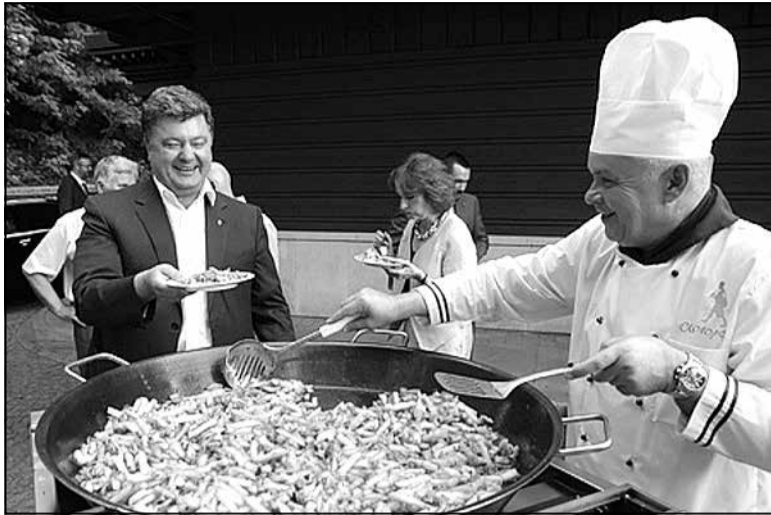
Дзмітрый Кісялёў частуе бульбай-фры колішняга міністра замежных спраў і будучага пятага прэзідэнта Украіны Пятра Парашэнку. Фота зроблена ў 2011 годзе падчас аднаго з свецкіх раўтаў у Кіеве, арганізаванага клубам «Сковорода».

Значная частка гэтых спікераў паралельна ўдзельнічала і ў мерапрыемствах сястрынскіх клубаў — «Импрессум» і «Формат-А3».