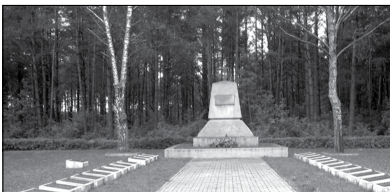
Брацкая магіла савецкіх воінаў у в. Капчамесціс