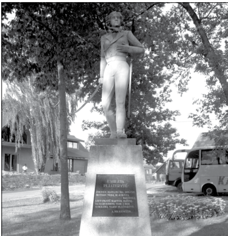
Помнік Эміліі Плятэр