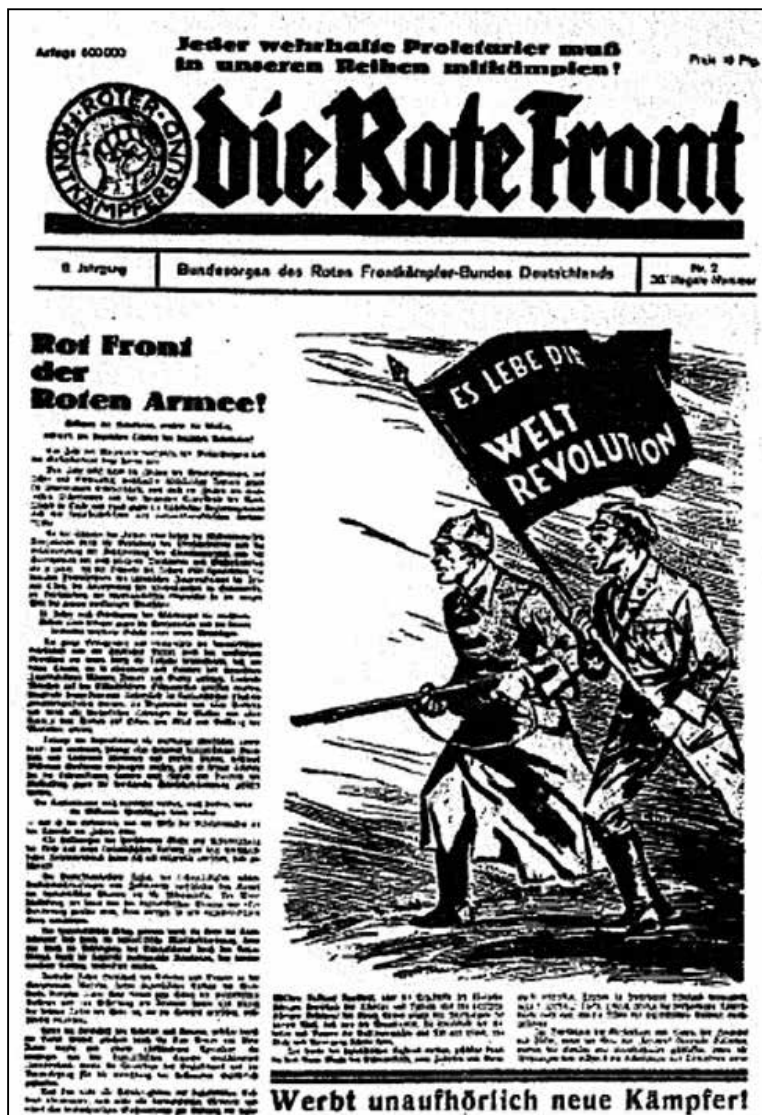
Газета нямецкіх камуністаў з заклікам да сусветнай рэвалюцыі на 1-й паласе

Разам з тым, калі чытаеш у паказаннях Дружылоўскага, пра ўсе гэтыя «сакрэтныя інструкцыі па ўзброеных выступках» ды «падпольныя ячэйкі ў балгарскай арміі», якія ён фабрыкаваў і перадаваў у амбасады, міжволі ўзгадваеш гісторыю з «Фрау А.» у беларускім пасольстве ў Германіі ды «заклікі да паўстання» са ўзламаных старонак у сацсетках у сакавіку 2017 года. Раней, каб дыскрэдытаваць структуру альбо чалавека, трэба было фальсіфікаваць бланк, сёння — узламаць профіль у facebook, усяго толькі. Агулам жа метады спецслужбаў застаюцца тыя ж самыя — як кажуць, нічога новага няма пад сонцам.