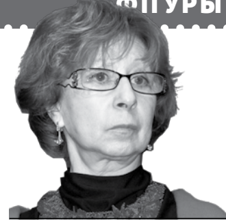
Лія Ахеджакава Культывая расійская актрыса падтрымала абаронцаў урочышча «Курапаты».

Народная актрыса Расіі Лія Ахеджакава («Службовы раман», «Масква слязам не верыць», «Гараж» і інш.) сказала «Радые Свабода», што ведае пра Курапаты як месца масавых расстрэлаў, а навіну пра адкрыццё там рэстарана ўспрыняла вельмі эмацыйна.