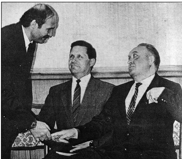
На пасяджэнні Цэнтрвыбаркама для рэгістрацыі кандыдатаў Зянон Пазыняк Вячаславу Кебічу рукі не падаў, а Аляксандр Лукашэнка «задаволіўся двума пальцамі Вячаслава Францавіча», пісала газета «Свабода» ў 1994 годзе.

Трэцяга лютага 1995 года Беларусь наведваў кіраўнік Дзярждумы Расіі Іван Рыбкін, які выступіў у Вярхоўным Саўеце. Парламенцкая апазіцыя БНФ рашуча выказалася супраць выступлення расійскага гасця — прадстаўніка краіны, якая знаходзілася ў стане вайны. Але кансерватыўная парламенцкая большасць усё ж дала слова Рыбкіну, які казаў пра супольныя гістарычныя карані беларускага і расійскага народаў, неабходнасць інтэграцыі, збліжэння заканадаўства. Закрануў спікер расійскай Дзярждумы і тэму Чачэнскай вайны. Ведаючы, што Расія сама яе развязала, Рыбкін па-фараўска сцвярджаў, што «на юге России поселилось средневековье».