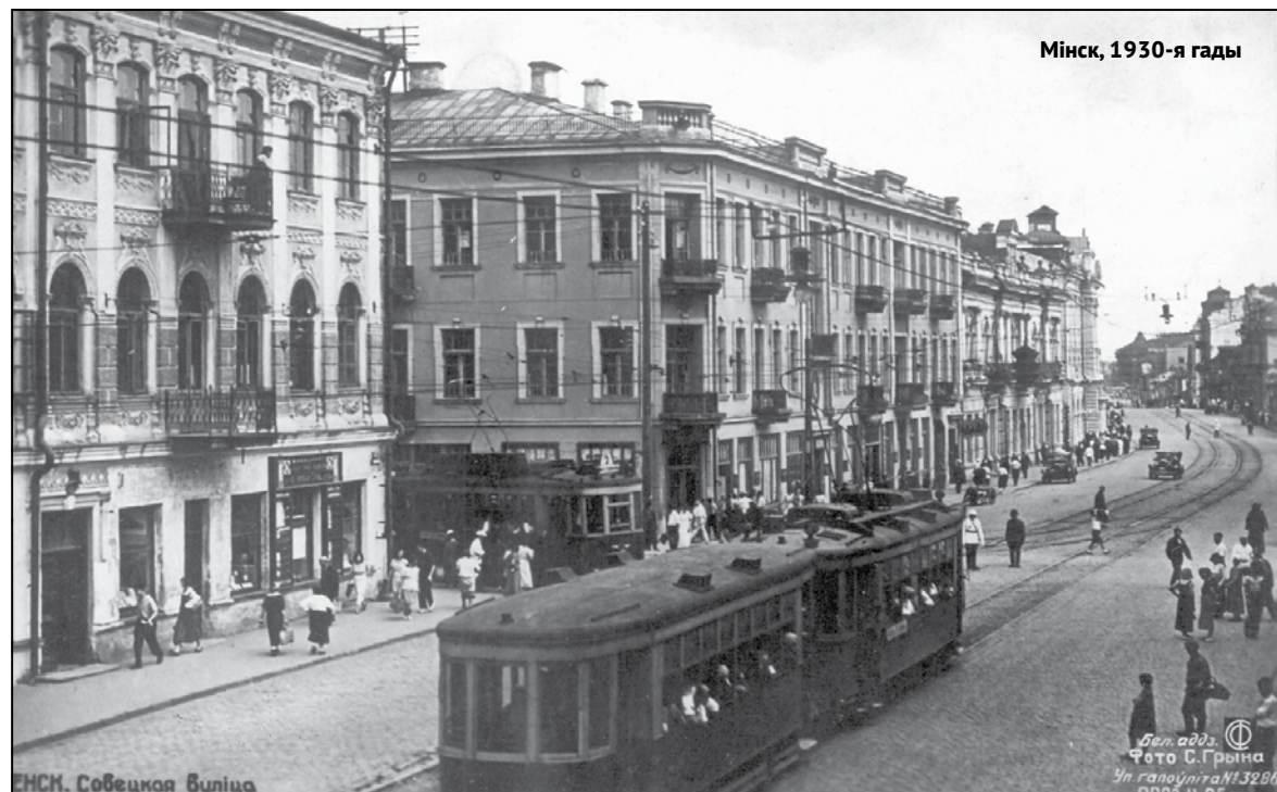
Мінск, 1930-я гады

а. Папярэдняе прызнанне Мінска як адзінага культурнага і палітычнага цэнтра, на які павінен арыентавацца беларускі рух Польшчы, Літвы і Латвіі. Унесці ў дэкларацыю гэтак прызнанне. Барацьба су-