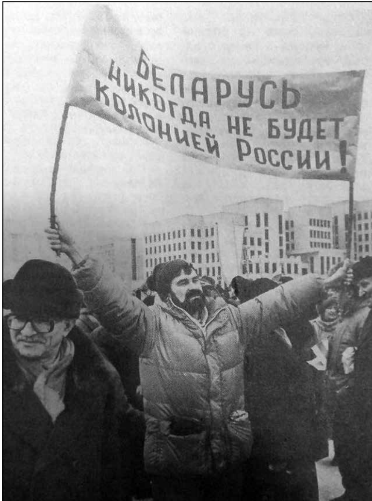
Мітынг на плошчы Незалежнасці ў Мінску падчас ратыфікацыі Вярхоўным Саветам Беларусі 12-га склікання дагавора аб стварэнні СНД, 10 снежня 1991 года.

У пачатку студзеня 1995 года ў Мінску высаджыўся расійскі дэсант: прэм'ер-міністр Віктар Чарнамырдзін, міністр замежных спраў Андрэй Козыраў, старшыня Савета Федэрацыі Уладзімір Шумейка... Вынікам стала падпісанне 6 студзеня 1995 года пагаднення пра стварэнне Мытнага саюза.