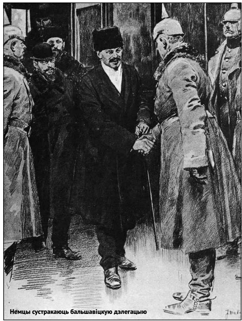
Немцы сустракаюць большавіцкую дэлегацыю