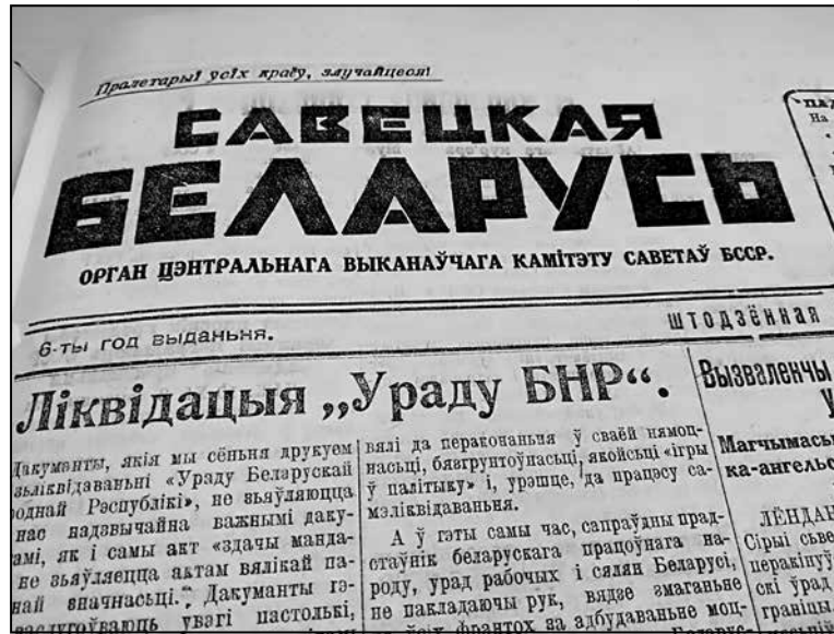
Газета «СБ» пра канферэнцыю БНР у Берліне