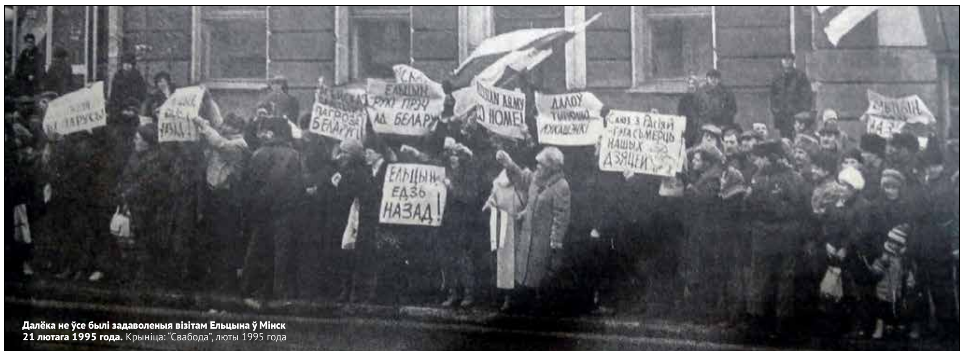
Далёка не ўсе былі задаволеныя візітам Ельцына ў Мінск 21 лютага 1995 года.