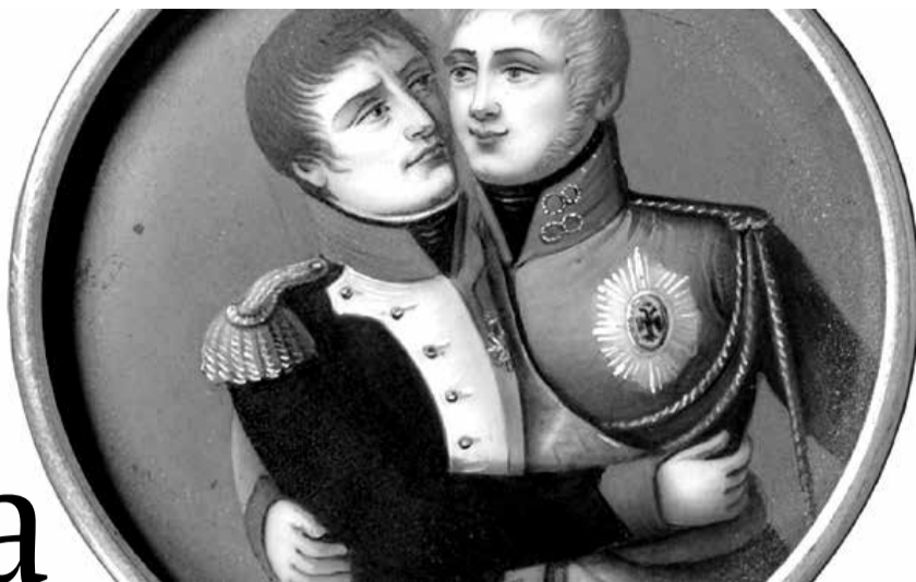
Абдымкі Напалеона і Аляксандра I на мініяцюры, прысвечанай Тыльзіцкаму міру

Датай скону Рэчы Паспалітай прынята лічыць 1795-ы, год