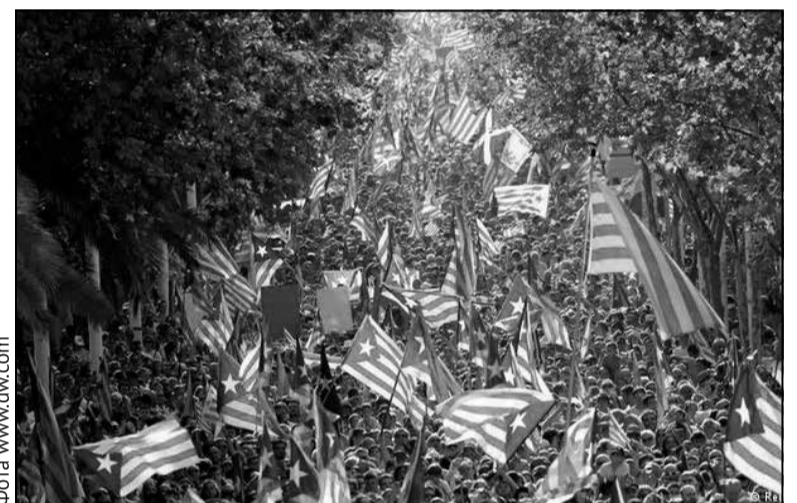
У снежні каталонскія незалежнікі зноў атрымалі большасць у парламенце

спробамі абвясціць незалежнасць Каталоніі. Хутка падпісчыкаў на акаўнт Табарніі ў інтэрнэце стала больш за 660 тысяч. Табарнііцы таксама прыдумалі свой сцяг, гімн, іншыя атрыбуты дзяржаўнасці. А зараз, як бачым, паўстаў яшчэ і інстытут прэзідэнта.