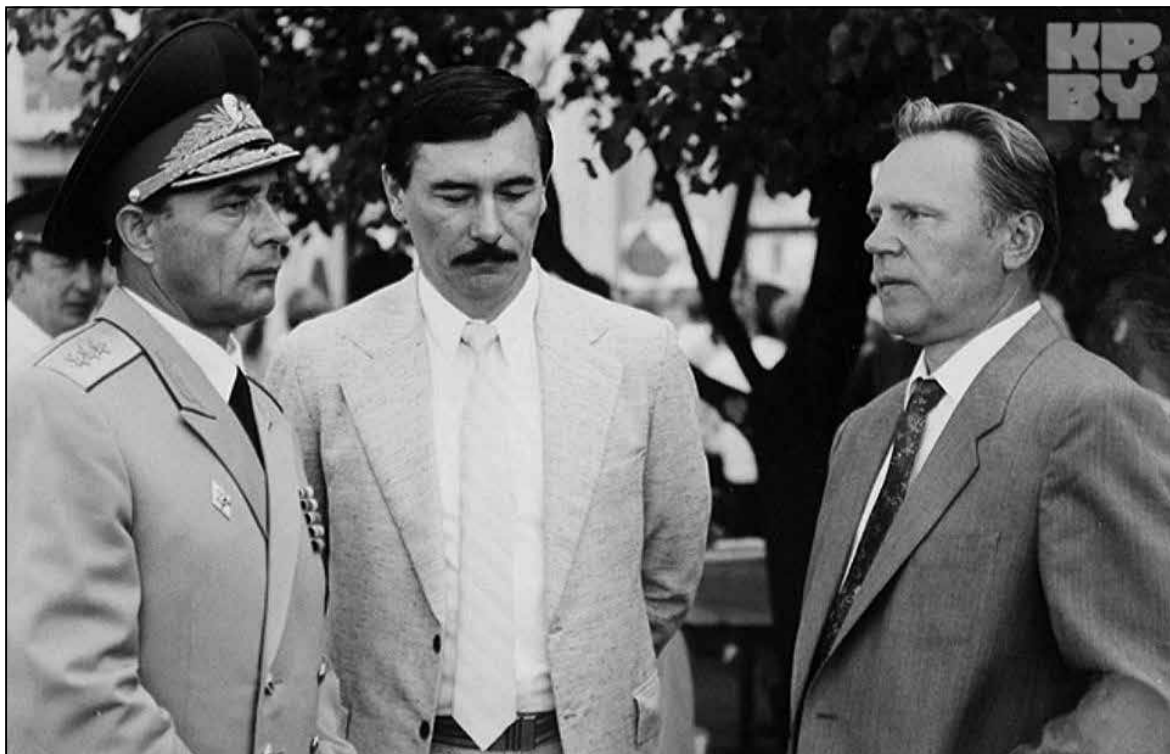
Злева направа: міністра абароны Анатоля Кастэнкі, Юры Захаранка і шэф КДБ Уладзімір Ягораў у Мачулішчах у ліпені 1994 года