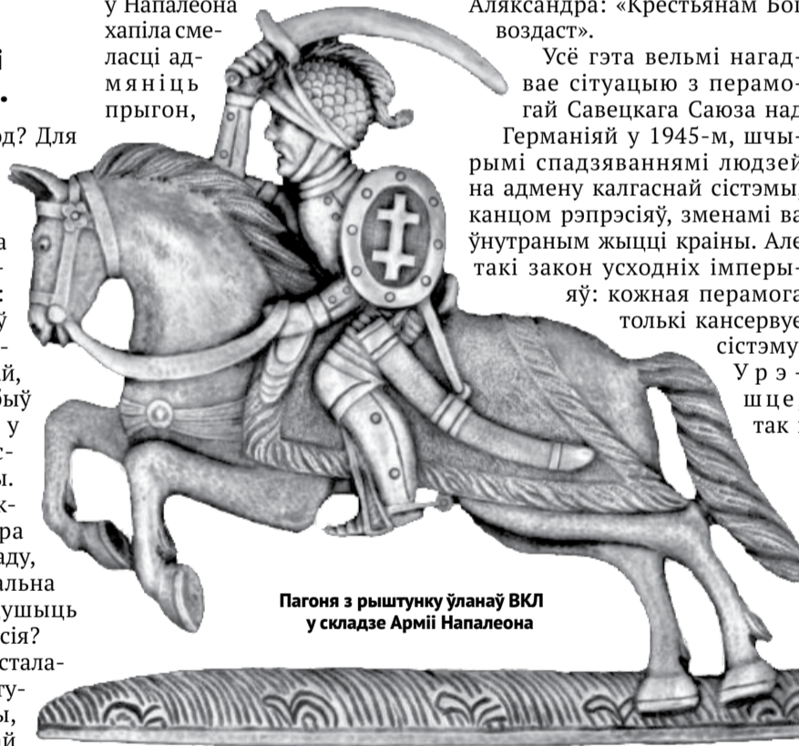
Пагона з рыштунку ўланаў ВКЛ у складзе Арміі Напалеона

«Дубіна» ў рэальнасці — гэта хаос, пагромы і рабункі. Калі б у Напалеона хапіла сме- ласці ад- мяніць прыгон,