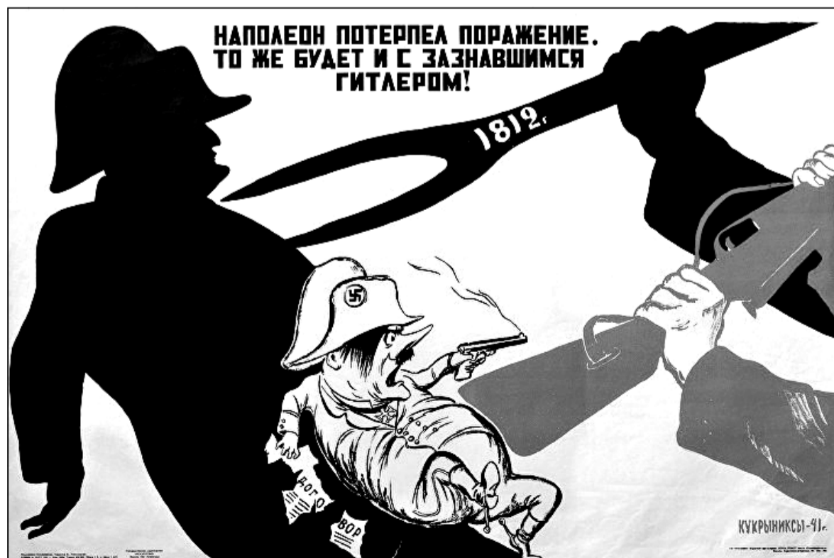
Цень Напалеона ў Другой сусветнай вайне — плакат Кукрыніксаў, дзе праводзіцца паралель між Банапартам і Гітлерам

Напалеон, гэтым часам, няспынна ваюе: супраць яго ладзяць кааліцыі, ён іх разбівае. У 1805-м ён граміць аўстрыйцаў і рускіх пад Аўстэрліцам. У нейкім сэнсе бітва ў далейшым вырашыць лёсы Еўропы: менавіта тады малады Аляксандр I, які спрабаваў кіраваць войскамі персанальна, церпіць асабістую паразу, а гэта — крыўда на ўсё жыццё. Ягоная мара быць